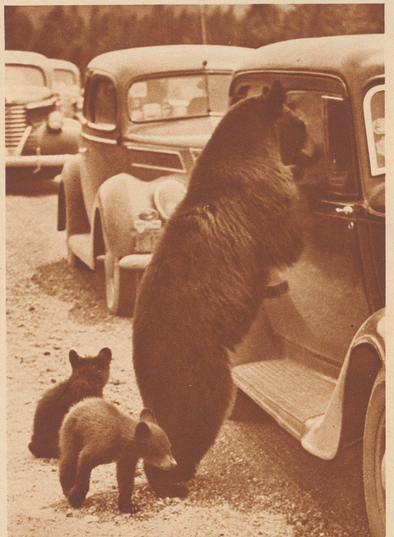
Die Braunbären vom Yellowstone National Park in Nordamerika kommen aus den Urwäldern auf die Autostraße und betteln bei den Touristen um Nahrung.

Solution de la question posée dans notre précédent numéro: L'arbre de Noël se trouve sur la place de Lyss (canton de Berne).