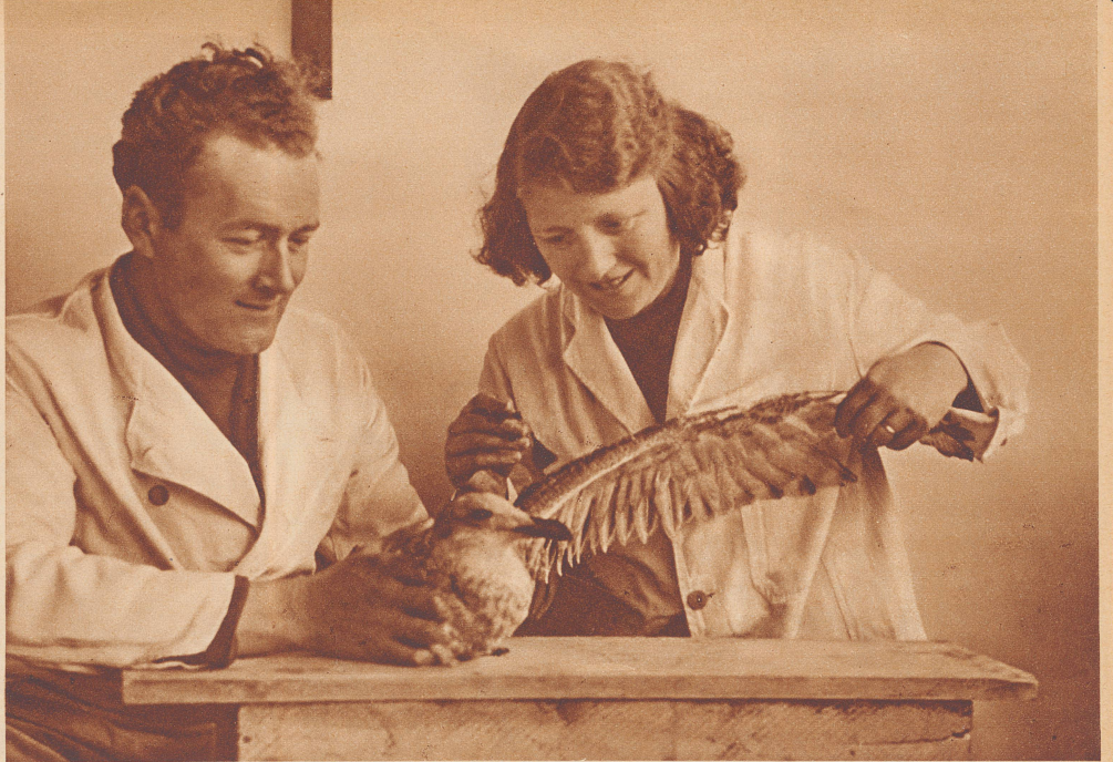
Der Fischhändler und seine Frau untersuchen den gebrochenen Flügel ihres «Findelkindes».

Jetée par la tempête contre la façade d'une maison, une mouette se brisa l'aile. Un marchand de poisson et sa femme qui passaient dans ces parages ramassèrent l'oiseau, l'emportèrent et comme on le voit, lui prodiguèrent avec tendresse leurs soins.