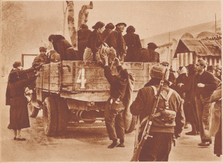
Ein Flüchtlingstransport kurz vor der Abfahrt aus Tarragona. Der Feind ist nicht mehr weit entfernt, dennoch gibt es beim Beladen und Beladen der Lastwagen keinerlei Panik. Die wenigen Soldaten, welche die Transporte betreten, mischen sich nur mit ein paar Ratschlägen ein. Tous les surveillants de quelques soldats, les habitants de Tarragona montent à bord des camions, qui les conduisent à Barcelone.