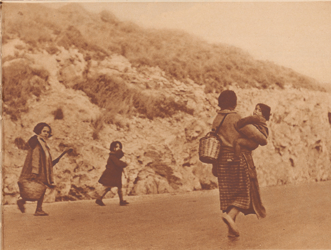
Eine Mutter auf der Flucht mit ihren Kindern.

Une paysanne tient son fils par la main. Derrière ce couple, marche la dactylo du président de commune d'une petite ville catalane dont tout l'avoit tenu dans une petite corbeille.