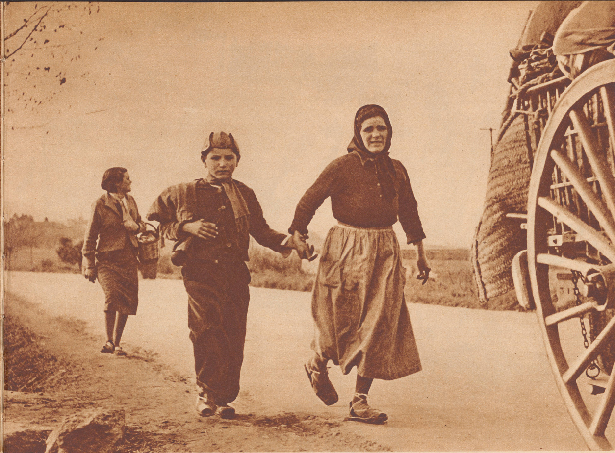
Eine Bäuerin mit ihrem Sohne, hinter den beiden das Bürofräulein des Gemeindepräsidenten einer kleinen katalanischen Stadt. Gerade ein Körbchen konnte sie noch mitnehmen, als der Feind eindrang.

Une paysanne tient son fils par la main. Derrière ce couple, marche la dactylo du président de commune d'une petite ville catalane dont tout l'avoit tenu dans une petite corbeille.