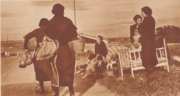
Frauen auf der Flüchtlingsstraße wandern und andere die auf die Camions für den Transport der Flüchtlinge warten. Die Wandernden müssen mit sehr wenig ankommen, die sindert plündern, unter die Umkleekabinen in der wackeligen für sich selbst und die Frauen rechts mit einer Matratze infolgedessen, aber der kleine Junge muß nach ihrer Meinung sein Kuscheltier behalten.

Les fugitifs, qui ne disposent d'aucun véhicule attendent au bord de la route, le passage prochain d'un camion. Dans leur regard, les habitants ne peuvent exprimer que leur peu de espoir. On voit un peu au-dessus des objets qui transportent, tel le contenu d'un panier de terre ou d'une bombonne à vin, tel autre d'un animal, une tendresse tout au moins, au lit de son enfant.