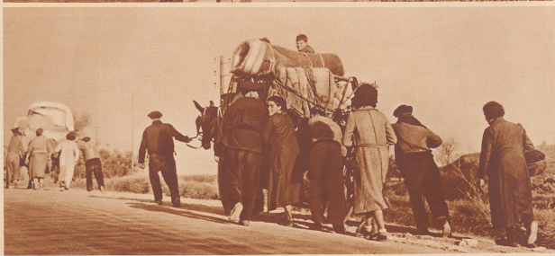
Die Straße steigt höher an, die Maultiere sind überfordert, die Wagen überladen, vorwärts, fort, nur fort ist der Gedanke. So legt jeder seine Hand an und hilft schüchtern — wahn! Nach Barcelona: aber was wartet ihre dort?

Les fugitifs, qui ne disposent d'aucun véhicule attendent au bord de la route, le passage prochain d'un camion. Dans leur regard, les habitants ne peuvent exprimer que leur peu de espoir. On voit un peu au-dessus des objets qui transportent, tel le contenu d'un panier de terre ou d'une bombonne à vin, tel autre d'un animal, une tendresse tout au moins, au lit de son enfant.