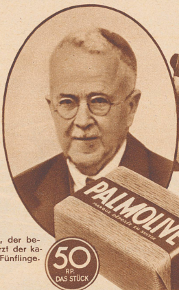
Dr. Dafoe, der berühmte Arzt der kanadischen Fünflinge.

Bei der frühzeitigen Geburt der kanadischen Fünflinge war nur Olivenöl mild genug für ihre Haut! Später wählte Dr. Dafoe ihre Seife mit größter Vorsicht aus. Seine Wahl fiel schließlich auf Palmolive, die Olivenölseife. Sicher sollte solch ein Beispiel von Frauen, die zu ihrem Teint und der Haut ihrer Kinder Sorge tragen, nicht übersehen werden. Benützen Sie selbst Palmolive.