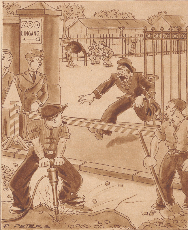
Zwischenfall im Zoo.

«Oh, da tragen Sie ja einen in unserem Vaterland berühmten Namen!» sagte der König. «Wissen Sie etwas von Ihrem großen Namensvetter?» «Jawohl, Majestät! Der Herr Leutnant hat mir gesagt, daß der Luftschiffer Andree im Ballon den Nordpol erreichen wollte, aber nicht zurückkehrte.» «Hat der Leutnant Ihnen noch mehr von Andree erzählt?» «Jawohl; er sagte, es wäre ein Jammer, daß er mich nicht mitgenommen hat!»