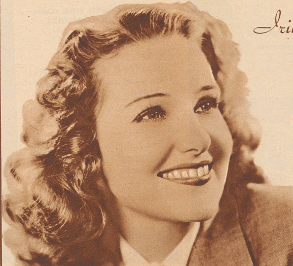
Lola Lane, Star of Warner Bros. Pictures, appearing in "Four Daughters".

Irium in Pepsodent Zahnpaste begeistert Millionen —