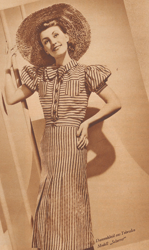
Damenkleid aus Tobralco Modell „Sclerops“