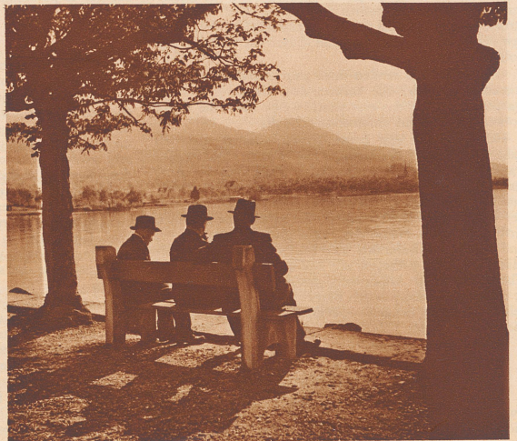
Siesta am See. Hart am Ufer steht die «Bank der Alten». Von hier schweift der Blick ungehindert auf die spiegelnde Fläche.

Sur le «banc des anciens» des vieillards font la sieste, le regard perdu dans le lointain ou simplement dans la fumée d'un «stump».