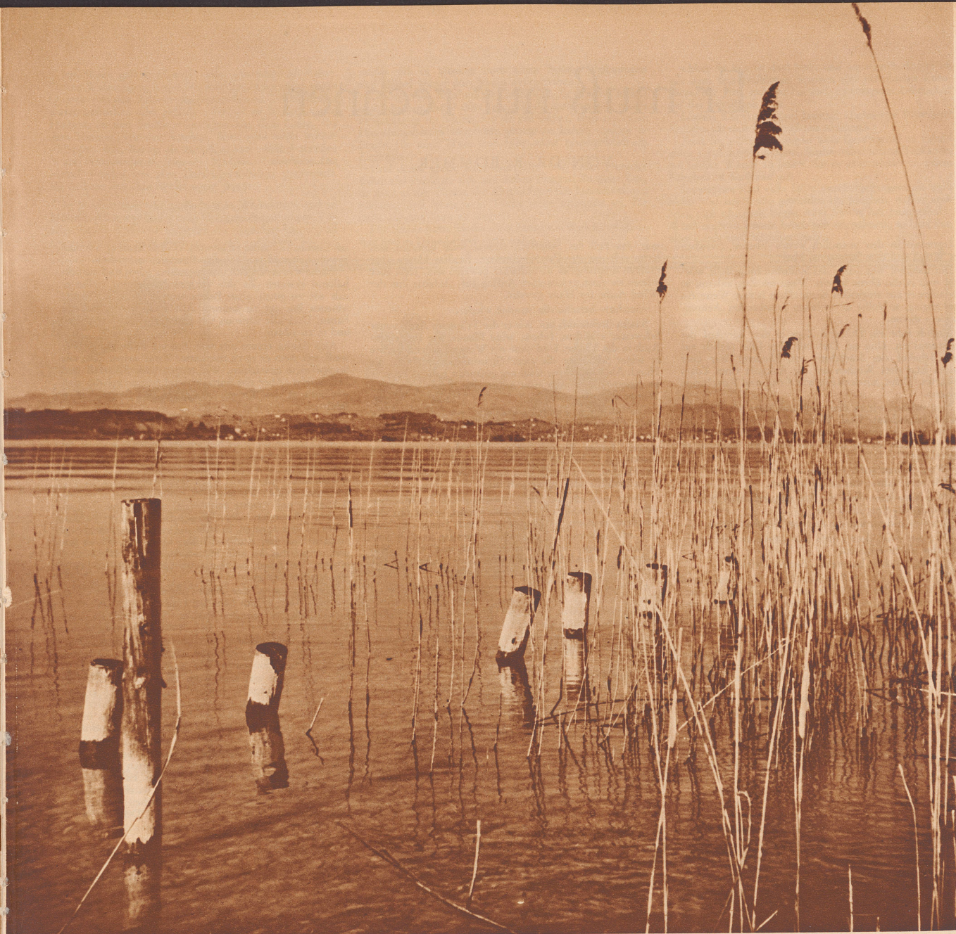
Blick durch den Schilf hinaus auf den See. Das ist sicherlich ein Bild, das manchem von uns vor Augen steht, wenn er an einen unserer Seen denkt. Les roseaux desséchés par l'hiver meurent, tandis que surgissent de nouvelles pousses.

mer, wenn er seinen breiten Rücken willig für das Spiel der bunten Boote, der weißen Segler, der braunen Schwimmer hergibt? An den heißen Tagen, wenn er bleiern heiß, ein gigantischer Strom scheinbar, in der trägen Mittagshitze schaukelt, in den kühlen Nächten, wenn er, noch warm von der Sonnenglut des Tages, wohlzig zu schlafen scheint? Oder sind es gar nicht die Jahreszeiten, die ihn so magisch verwandeln, Fluß und Strom, ja sogar Meeresbucht aus ihm machen, sind es die Tageszeiten, Morgenfrische und Mittagsstille, Abendfrieden und nächtliche Einsamkeit?