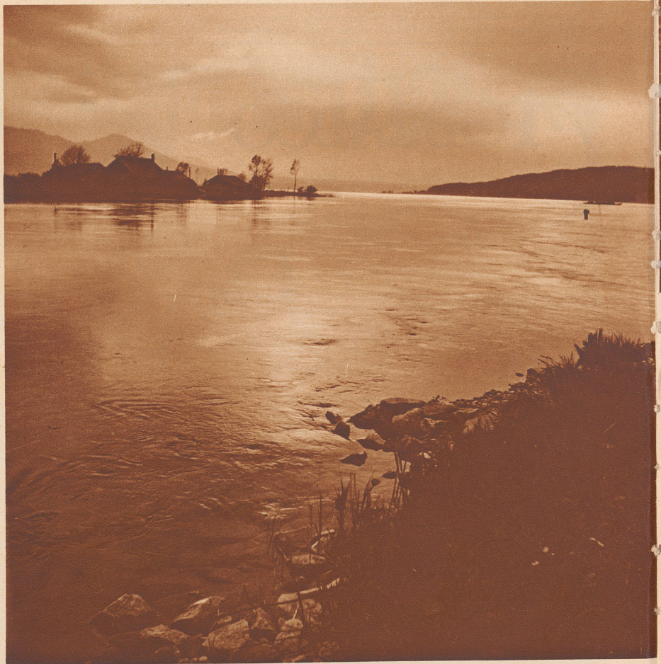
Der Fluß wird zum See. — Le fleuve s'élargit, forme le lac.

Sur le «banc des anciens» des vieillards font la sieste, le regard perdu dans le lointain ou simplement dans la fumée d'un «stump».