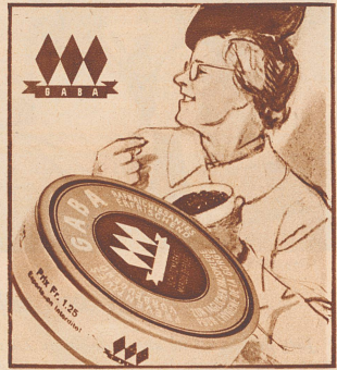
„Immer einige freundliche Worte auf den Lippen und Gaba auf der Zunge. Das ist gut für die Stimmung des Hauses und für die eigene Stimme.“