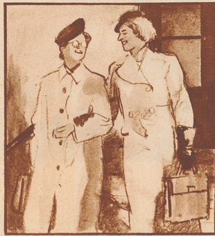
Ihre Nachfolgerin fragt, wie sie es fertig bringt, die Stimme so klar zu erhalten; man wird doch leicht heiser bei dieser Tätigkeit.