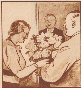
Sonderbar, denken die Kolleginnen, sie macht eine gute Partie und ist doch eigentlich keine Schönheit. Aber die weiche, sympathische Stimme hört jeder gern.