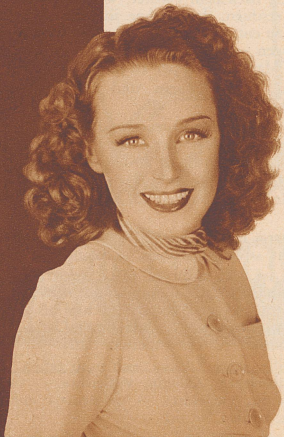
Rosemary Lane, Star of Warner Bros. Pictures, appearing in "Four Daughters".