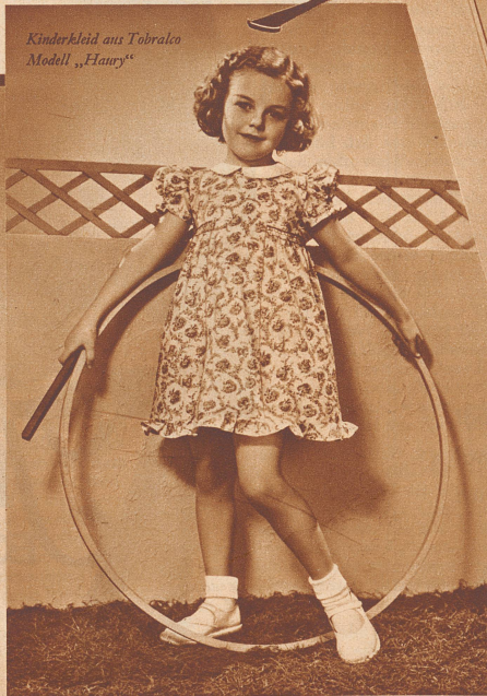
Kinderkleid aus Tobralco Modell „Haury“

der ideale Stoff für Frühjahr und Sommer