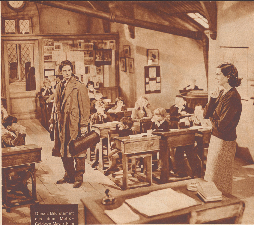
Dieses Bild stammt aus dem Metro-Goldwyn-Mayer-Film