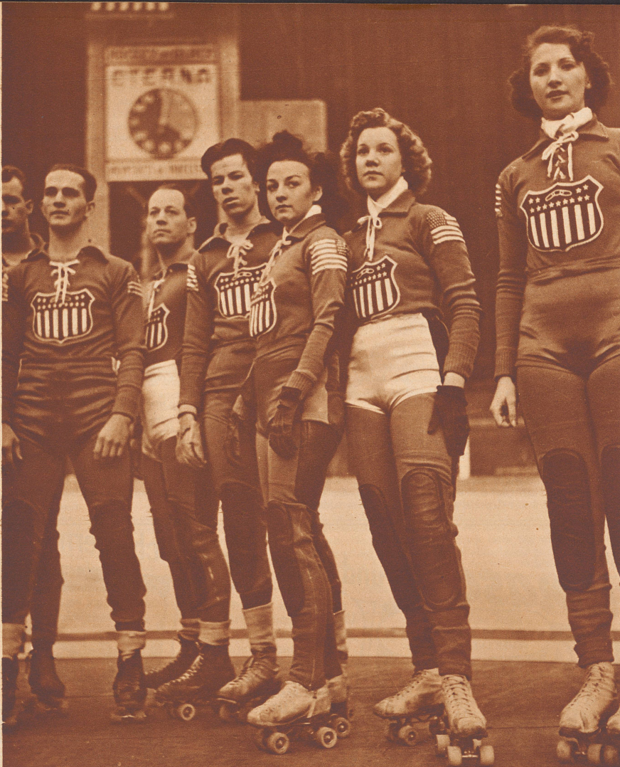
Ein neuer Sport-Anblick

Dies ist eine Roller-Catch-Mannschaft, aus Amerika nach Paris gekommen, bestehend aus 6 Männern und 6 Frauen. Ihnen trat gegenüber eine europäische gemischte Mannschaft, die aus Vertretern verschiedener Länder sich zusammensetzte. Es handelt sich um ein Mannschafts-Bahn-Laufen auf Rollschuhen, jeder Mann und jede Frau muß je eine Viertelstunde laufen. Es gibt Punkte fürs Überholen in verschiedener Abstufung. Die Mannschaft mit der größten Gesamtpunktzahl ist Sieger.