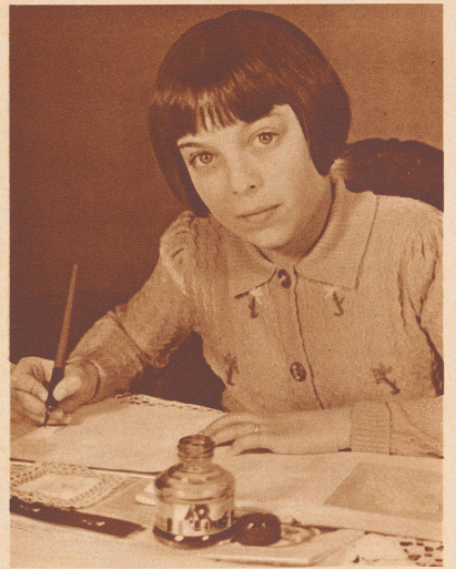
Die 11jährige Komponistin

Importé des Etats-Unis, le «roller catch» a conquis le public parisien. Cette course poursuite que dispute sur 4000 kilomètres deux équipes mixtes se complique de combats épiques et brutaux entre les participants.