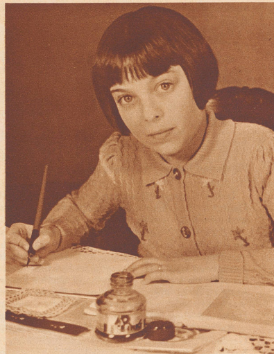
Die 11jährige Komponistin

Importé des Etats-Unis, le «roller catch» a conquis le public parisien. Cette course poursuite que dispute sur 4000 kilomètres deux équipes mixtes se complique de combats épiques et brutaux entre les participants.