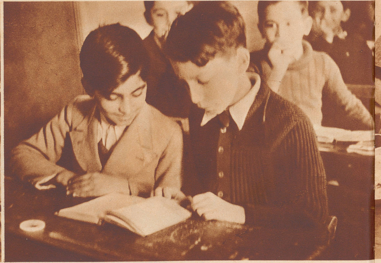
Gleiches Schulprogramm in Tunis wie in Paris. Es gibt zwei Arten Schulen in Tunesien: französische und franco-arabische Schulen. Beide unterstehen dem französischen Unterrichtsdirektor. Für beide ist das Schulpensum vollständig gleich wie in Frankreich. Nur wird in den franco-arabischen Schulen während fünf Stunden pro Woche auch die arabische Sprache und Schrift unterrichtet. Sonst ist auch in ihnen die Unterrichtssprache Französisch. Die meisten Eingeborenenkinder verstehen bei Schulbeginn kein Wort Französisch, und doch wird von der ersten Stunde an Französisch auf sie eingelesen. Deshalb der verwunderte Ausdruck, mit dem der Schüler seinen Lehrer anblickt. Es ist ein wesentlicher Bestandteil der französischen Politik, die französische Sprache zur Umgangssprache des gesamten französischen Kolonialreichs zu machen.