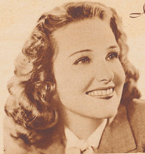
Lola Lane, Star of Warner Bros. Pictures, appearing in "Four Daughters".

Irium in Pepsodent Zahnpaste begeistert Millionen — jeden Morgen erneut — durch das neue blendende Weiss, das es den Zähnen verleiht! Nie zuvor konnte solch strahlender Glanz mit einer so absolut unschädlichen Zahnpaste erzielt werden. Ja, mit IRIUM-haltigem Pepsodent riskieren Sie nichts... keine Möglichkeit, dass Ihr kostbarer Zahnschmelz angegriffen wird.