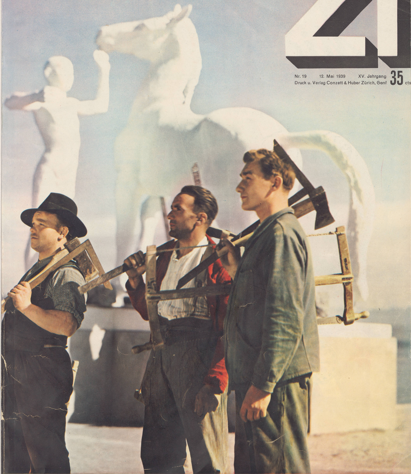
Aufnahme Schuh, Photocolor-Tiefdruck Conzett & Huber