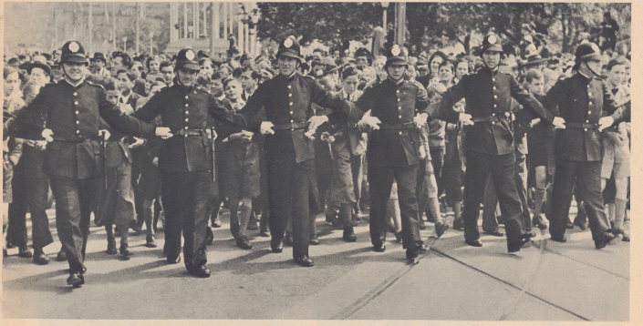
Der Schluss des Festzuges. Die Zürcher Polizei kennt die Ueberraschungsgeschichten, die entstehen, wenn nach vollendetem Vorbeimarsch der Umzüge plötzlich die Zuschauermenge brechen, die Volk von beiden Seiten her die Straße füllt und durch ihre Breite und die Fülle der Menschenmassen hindurchzueilen möchte. Da heißt es: Dämme bauen! Eine solche Dämme aus verängstigten Polizeimännern, die — glücklicherweise — ihre Feststellung nicht völlig hinter ihren Ärmel strecken, sondern, bei unserm Reporter hier im Bild, festhalten. Passé le dernier dragon, l'armée le cortège, il faut se précipiter. Pour maintenir l'ordre, les gendarmes forment le mur et gardent le sous.