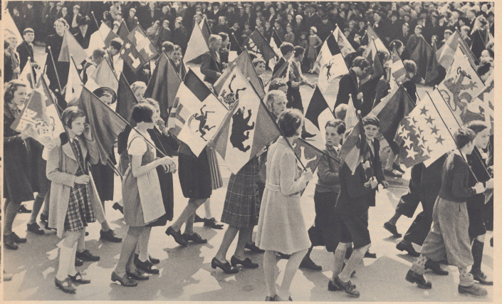
Diesemselbst Zürcher Sachverständigen stand am Festzug Später. Sie schwengen die fälschlich identischer Schweizergruppen. Zeitliches Bild: Gesamtwort und Jugend. Bis zur kleinsten Gemeinde ist die Schweiz an der großen Landesfeier beteiligt, und der Schweizerzug hat sich die LA erwidern. In alle Zehen, die Ausdruck geben, was Geist und Anhänglichkeit der Heimat herzugeben. Bild: Die jugendlichen Fahnenträger schlossen sich dem Ende des Festzuges an und marschierten mit. Passent 3000 enfants portant les emblèmes de 3000 communes suisses.