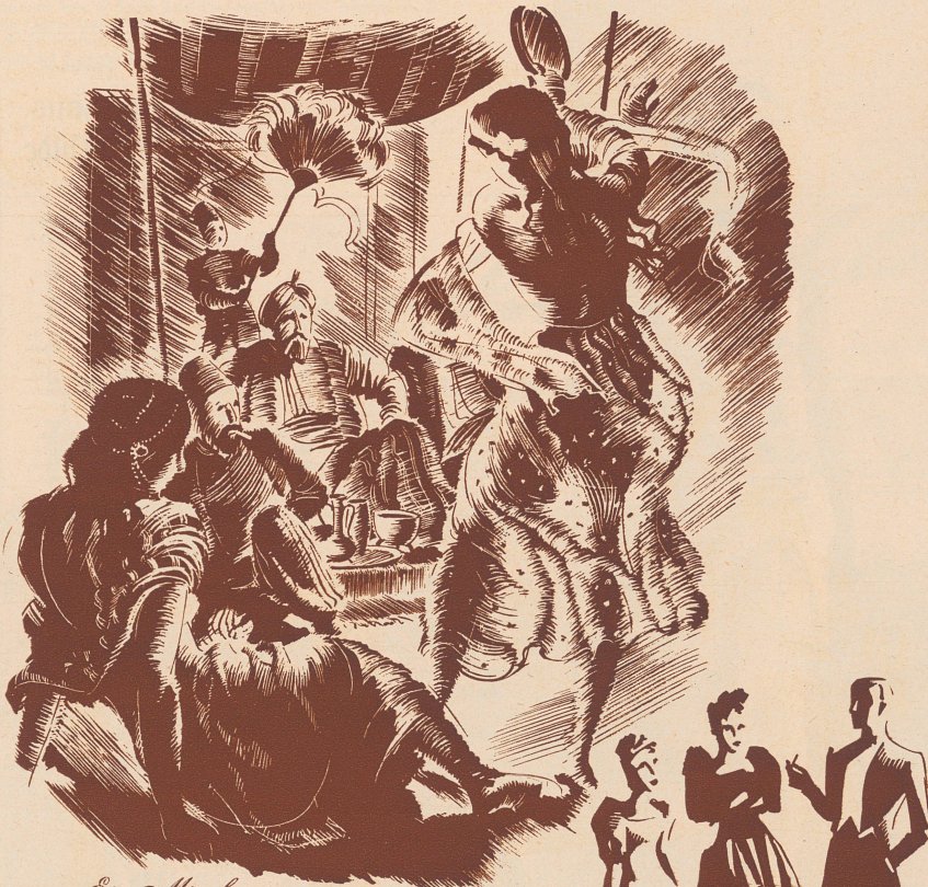
Ein Märchen aus tausendundeiner Nacht

«Ich will dir etwas geben, das du auf dem Herzen tragen sollst. Dann wird dir wieder die Sonne scheinen. Am Tage, wo du dich zum ersten Male wieder glücklich fühlen wirst, darfst du das Amulett öffnen. Und ich