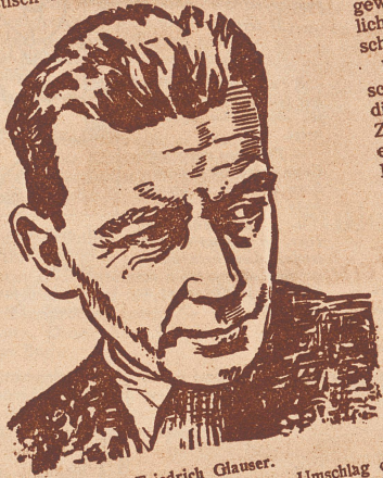
Friedrich Glauser. (Bildnis von Max Billeter auf dem Umschlag des besprochenen Buches.)

E. F. Friedrich Glauser, der im Dezember 1938 als Dreißigjähriger starb, war eine der merkwürdigsten Gestalten des neuern schweizerischen Schrifttums. Schon dem Herkommen nach den gegensätzlichsten geistigen Bezirken zugehörig und verschiedenen Lebens- und Bildungswelten verpflichtet, außerdem unzweifelhaft mit dem Erbteil abenteuerlicher Ausschweifungen belastet und durch den frühzeitigen Verlust seiner Mutter seelisch für immer überschattet, hat er doch, als er Sammlung und Kraft zum Schreiben und Gestalten fand, den charakteristisch schweizerischen Kriminal-, den