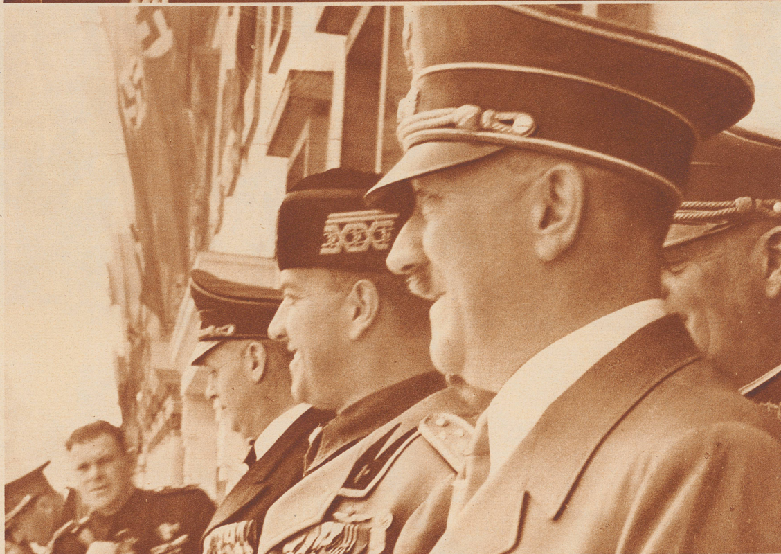
Nach der Unterzeichnung des deutsch-italienischen Militärbündnisses. Von rechts nach links: Reichskanzler Hitler, der italienische Außenminister Graf Ciano und von Ribbentrop nehmen auf dem Balkon der Reichskanzlei die Huldigung des Volkes entgegen.

Berlin. Après la conclusion de l'alliance militaire germano-italienne. Le Führer-chancelier, les ministres des Affaires étrangères Ciano et Ribbentrop apparaissent au balcon de la chancellerie du Reich pour répondre aux acclamations du peuple.