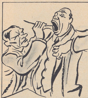
und die Blauband, besänftigt sie