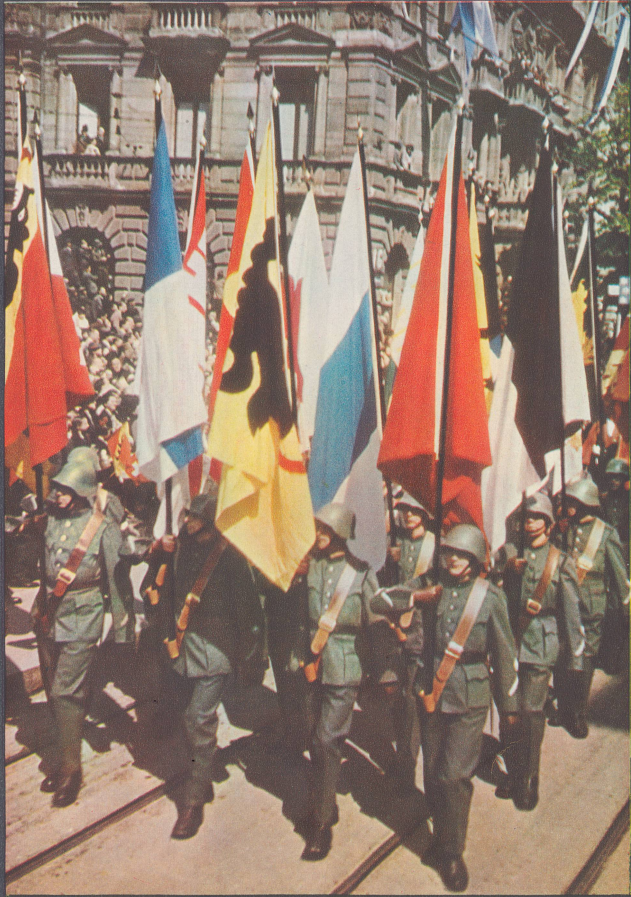
Die Fahnen der 22 Kantone, getragen von 22 Wachtmeistern der Armee. Le détachement des 22 sergents, porteurs des 22 bannières cantonales.