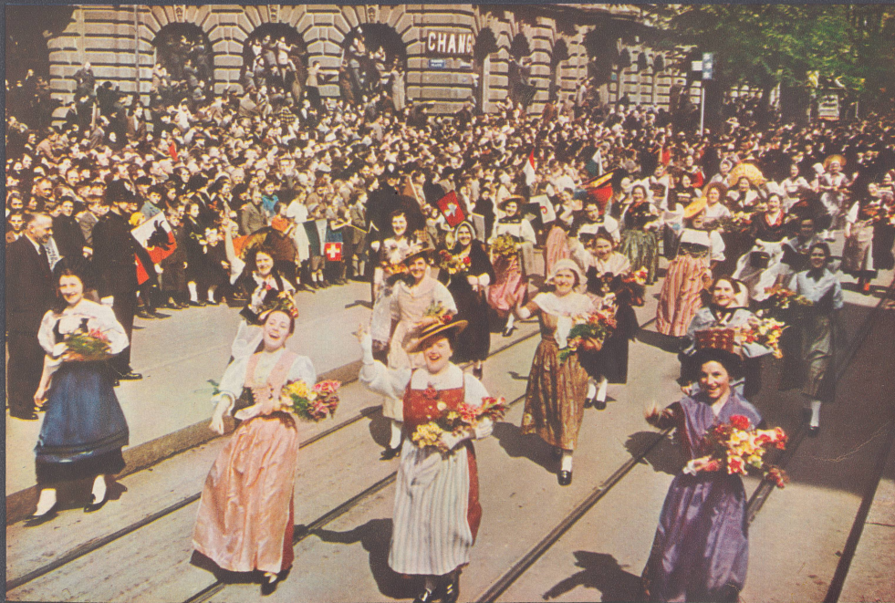
Freudige Trachtenmädchen aus allen Landesteilen.