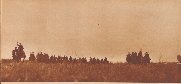
Polnische Dragoner bei einer Feldübungsübung im Schwadronverband. In Polen, diesem flachen Land der großen Dornen, weiten Räume und zum Teil wenig angebauten Strahlenzonen, spielt die Kavallerie noch eine sehr wichtige Rolle. Entsprechend zahlreich wurde sie bei der Schaffung der Armee berücksichtigt. Es gibt Kavallerie, die hauptsächlich polnische Kavallerie ist die beste der Welt. Aufgeteilt ist sie in 12 selbständige Kavalleriebrigaden zu je 3 bis 4 Regimentern zu 3 Schwadronen. Von diesen 3 Schwadronen sind 4 reine Reiter-Schwadronen ausgestattet mit LMG, die fünfte ist eine Mitrailleurschwadron, ausgestattet mit 12 schweren Maschinengewehren und einem Panzerwagen. Umfährte ein Drittel der Kavallerie ist motorisiert. «Escadron, en avant!», «Charge!» Dans un pays où les routes sont rares, la cavalerie peut jouer un grand rôle en temps de guerre. La cavalerie polonaise compte donc 12 brigades à 3 régiments. Ces régiments sont composés en 3 escadrons, dont 4 de cavalerie et 1 de mitrailleurs. Un tiers des effectifs de cette arme sont motorisés.