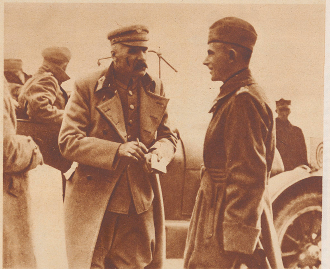
Vor 19 Jahren, zur Zeit des polnisch-russischen Krieges. Marschall Pilsudski (links) im Gespräch mit seinem damaligen Adjutanten und treuesten Waffengefährten, dem jetzigen Generalinspektor der polnischen Armee, Marschall Rydz-Smigly.