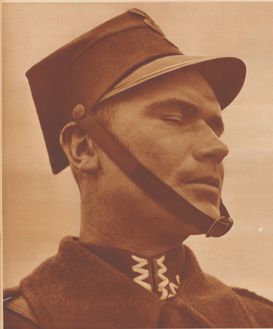
Der Typ des polnischen Kavalleristen, herangezogen aus der Mitte eines 30 000 Mann stählernen Elite-Regiments. Die persönliche Bewaffnung des polnischen Dragoners besteht aus Säbel, Karabiner und Lanze. Carabina, sabre et lance constituent l'armement des 30 000 cavaliers polonais, cavaliers dont la réputation de bravoure et d'endurance n'est plus à faire.