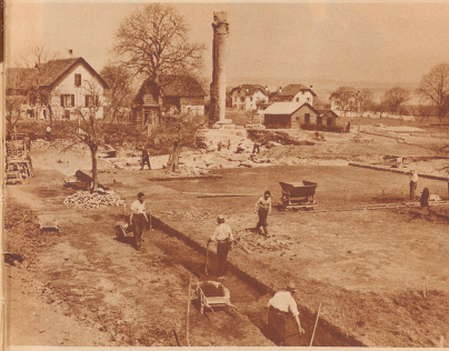
Blick auf die Ausgrabungsstätte von Avenches, wo gerade jetzt der Arbeitende mit den Freilegung eines Fundes beschäftigt ist. Das Bild zeigt nur einen ganz kleinen Teil des Ruinenfeldes von Avenches. Die bemerkenswerten Baudenkmäler von Avenches sind neben der Storchensiedel das Theater, das Amphitheater, einige Türme und Tore der Umfassungsmauer und Überreste der Mauer selbst. Diese Umfassungsmauer war ein unregelmäßiges Viereck von 4-7 Ecken und umschloß einen Raum, der zehnmal größer ist als die Fläche, welche die heutige Stadt bedeckt. Sie war ursprünglich 5,6 Meter hoch und 3 Meter dick. Heute beträgt die Mauerhöhe höchstens noch 2 Meter.

Le cigognier qui jadis — et jusqu'à ce jour — nichent au pied de la seule colonne restée debout du grand temple romain se valent le nom de «cigogniers». Ce nom lui fut donné dès la haute époque, même en son plaisir familles d'Avenches qui au XIV me siècle déjà l'avaient également renommée «cigogniers», soit en raison de la haute taille de leurs membres, soit en raison de leur résidence proche de la colonne.