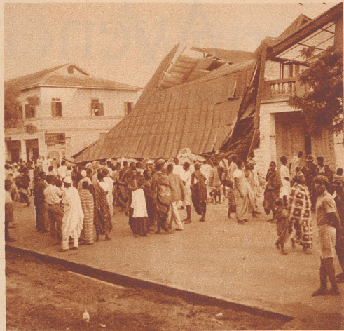
Nachricht aus Accra

Léopold III, Roi des Belges, salue les pilotes militaires suisses, les capitaines Schlegel et Thiébaud et le premier-lieutenant de Pourtalès, qui prirent part les 8 et 9 juillet au meeting international d'aviation de Bruxelles.