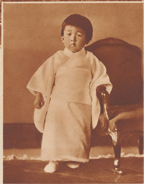
Der Kronprinz von Japan, Tsugu Akihito. Nachdem die kaiserlichen Eltern dreimal hintereinander Töchter gehabt hatten, war die Freude groß, als endlich ein Thronfolger geboren wurde. Obwohl es im Laufe der Geschichte auch japanische Kaiserinnen gab, so ist es heute doch konstitutionell nicht möglich, daß eine Frau den Thron Japans innehat.

Après trois filles, un fils naquit dans la Maison impériale: le Prince-héritier Tsugu Akihito. C'est lui qui ceindra la couronne, car si au cours de l'histoire dynastique de l'Empire du Soleil-levant, on vit parfois des femmes monter sur le trône, ce n'est plus aujourd'hui constitutionnellement chose possible.