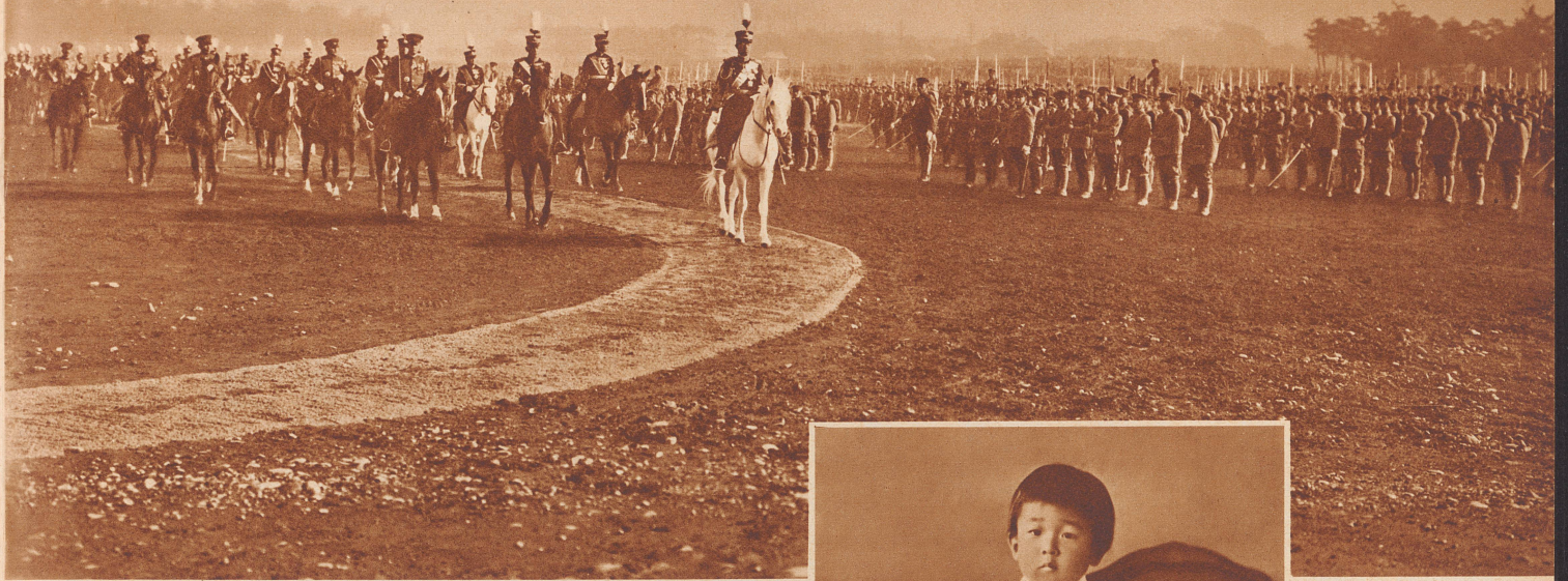
Der Kaiser von Japan, als der oberste Befehlshaber, bei einer Truppschau in Tokio. Er reitet immer sein berühmtes weißes Pferd, von dem man nur mit den ehrfürchtigsten Worten laut sprechen darf!

L'Empereur est le chef suprême de l'armée, le voici passant une revue de ses troupes aux environs de Tokio. Il est monté sur son fameux cheval blanc, qui comme lui même est chose sacrée, et dont on ne doit parler qu'en termes de profonde vénération.