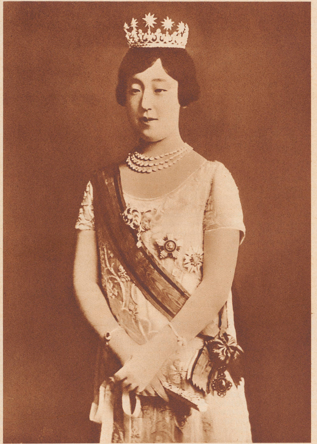
«Ihre Kaiserliche Majestät», die Kaiserin von Japan. Da es in Japan nur ein Kaiserhaus gibt, und da es nicht üblich ist, sich mit ausländischen herrschenden Häusern zu verbinden, sind die Kaiserinnen von Japan Adelige, die traditionell aus einer der fünf Familien, die dazu in Frage kommen können, gewählt werden.

Les livres d'histoire les plus sérieux l'affirment, les manuels scolaires nippons l'enseignent: Le Mikado est le descendant direct de la déesse du soleil, Amaterasu-O-Mikami. Quiconque oserait mettre en doute la suite dynastique des Empereurs du Japon depuis 2000 ans se verrait châtié pour haute-trahison.