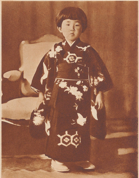
Die drei Töchter des japanischen Kaiserhauses, Teru, Taka und Yori in zeremonieller Kleidung. Sie besuchen alle die Adelschule in Tokio. Außerdem kam vor zwei Jahren noch ein kleiner Prinz, Yaasibi, zur Welt, so daß die Thronfolge absolut gesichert scheint.

Les trois Princesses impériales Teru, Taka et Yori suivent les cours de l'école de la noblesse de Tokio.