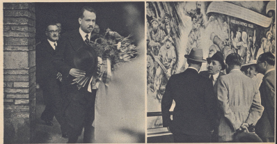
Fürst Franz Josef II. von Liechtenstein bei seiner Ankunft im Bahnhof Zürich am Liechtensteinfest der Stadt, Sonntag, den 16. Juli. 15. Juli: Journée du Liechtenstein. S. S. le Prince François-Joseph II de Liechtenstein débarque à la gare de Zurich-Sage.