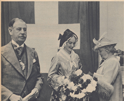
Links: Ankunft und Begrüßung des hohen Gastes aus England im Bahnhof Zürich. Sir Frank Bowdler, Lord Mayor von London, und Lady Bowdler erhalten vom einem Tischlermeister eine große Blumenschale.