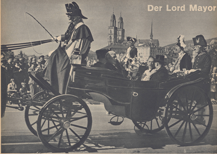
Die «Bade» procession durch die Strassen Zürich. In der Mitte des Bildes der Lord Mayor, an seiner linken Hand der Lord Mayor von London, rechts von ihm der Lord Mayor von Zürich. In der Mitte des Bildes der Lord Mayor, an seiner linken Hand der Lord Mayor von London, rechts von ihm der Lord Mayor von Zürich. In der Mitte des Bildes der Lord Mayor, an seiner linken Hand der Lord Mayor von London, rechts von ihm der Lord Mayor von Zürich.