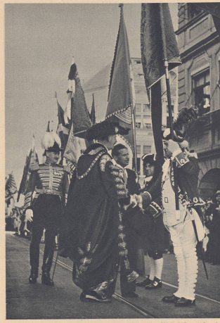
Nach dem offiziellen Akt im Zürcher Rathaus. Der Lord Mayor begrüßt die 24 Ratsmitglieder der Zürcher Stadt. Hinter dem Lord Mayor der City Marshal, rechts von ihm Vizebürgermeister von der Verkehrsbehörde als Dolmetscher.