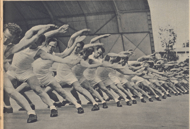
Das Wochenende des 11. und 12. Juli brachte der LA den Besuch der besten Turner und Schwinger der Schweiz. Bild: Die Turner Zürich bei ihrer Vorstellung in der gymnasialen Turnhalle.