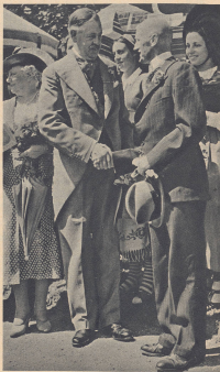
Rechts: beim Bundespräsidenten in Unter-Sargis, wo Bundespräsident Jost ihn, seine seine Frau und seine Tochter, die die Blumenschale darbringen. Bild: Der Lord Mayor von London, Sir Frank Bowdler, und seine Frau, Lady Bowdler, eine große Blumenschale.