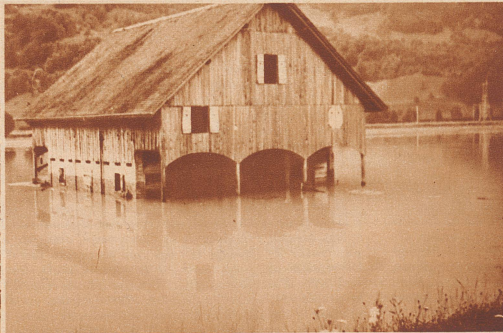
Im Urnerland, zwischen Erstfeld und Altdorf, ereignete sich ein Dammbuch der Reuß, der die ganze Altdorfer Ebene zum Teil über einen Meter unter Wasser setzte.