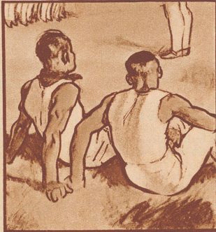
„Fabelhaft, diese flotte, präzise Zusammenarbeit! In unserer Riege klappt es nicht immer so.“