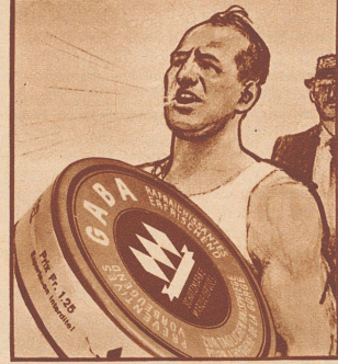
Das stimmt, der weiss, was ihm hilft. Er nimmt täglich Gaba, das hält die Stimme rein und klar.