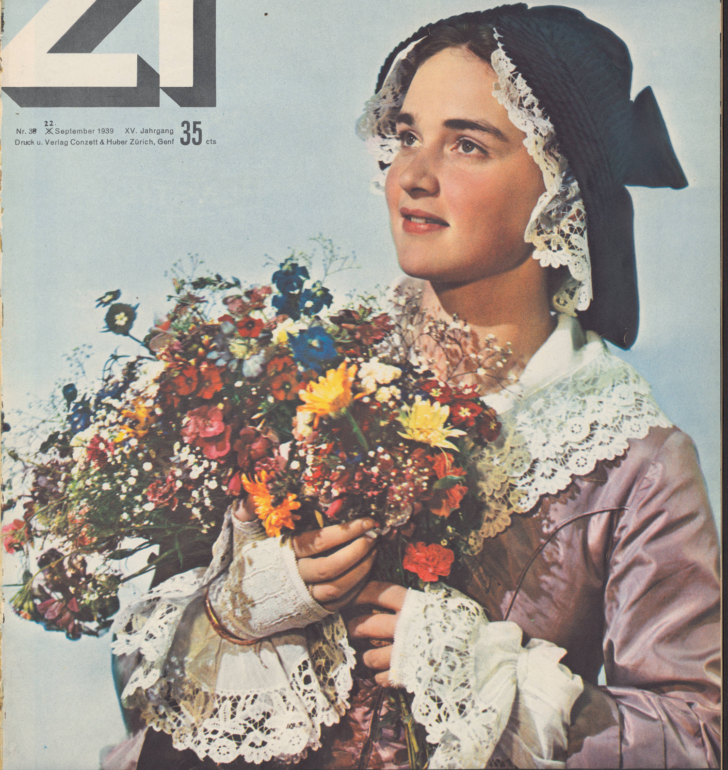
Aufnahme Schuh, Photocolor-Tiefdruck Conzett & Huber

Nr. 38 22. X. September 1939 XV. Jahrgang 35 cts Druck u. Verlag Conzett & Huber Zürich, Genf