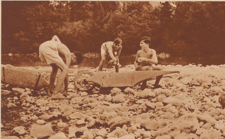
Peter II. (rechts) mit seinen Spielgefährten, die aus den besten Schülern seines Landes ausgesucht werden, in den Ferien. Pierre II (à droite) en vacances avec deux camarades choisis parmi les meilleurs élèves de son royaume.