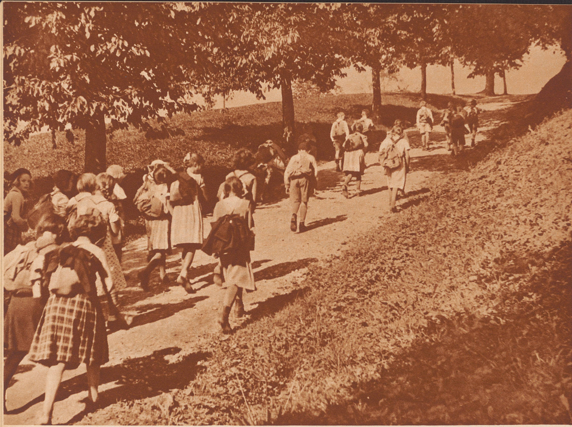
Aufstieg nach Salvisberg, der Runtigenfluh zu. — La montée de Salvisberg vers la Runtigenfluh.