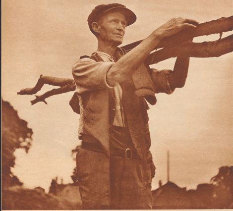
Ein englischer Bauer beim Holzen. Bauern, wie wir sie auf dem Kontinent kennen, gibt es in England nicht mehr. Die englischen Bauern sind Landbesitzer, Pächter, Jagdschutzhüter des Gutes. Das Ideal der eigenen Scholle kennen sie nicht. Solange es dem englischen Bauern gut geht, trägt er wenig danach, wenn der Grund und Boden gehört. In England ist diese Volksschicht vergrünlicht, und der Begriff des Bauernschichters und Bauernschichters vollständig unbekannt.

Rien de la sorte. Le monde des paysans anglais est fort différent de celui des paysans d'autres pays. Il ne possède point le sol qu'il cultive, il travaille pour le compte d'autrui, il est fermier, garde-jardinier ou jardineur de nuit et est fier de lui ne pas être plus malheureux. Il ne songe pas à l'émancipation tant que ses affaires sont prospères.