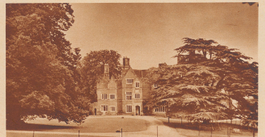
Das ist das aus rohem Backstein gebaute Gut- und Herrenhaus von Greenfield. Hier wohnt der Besitzer des Dorfes. Dieser «landlord» besitzt einige Hektar Land, ihm gehört Haus für Haus, ihm gehört jeder Stein und jede Scheffel Erde. Die Dörfer in England kennen deshalb keine Grundbesitzer und keine Grundbesitzer. Die vornehmen Leute wohnen ganz für sich auf großen Landgütern.

Sur la place du village est demeuré un vieux pilori où l'on enverrait jadis les possesseurs des paysans coupables de méfaits ou malversations.