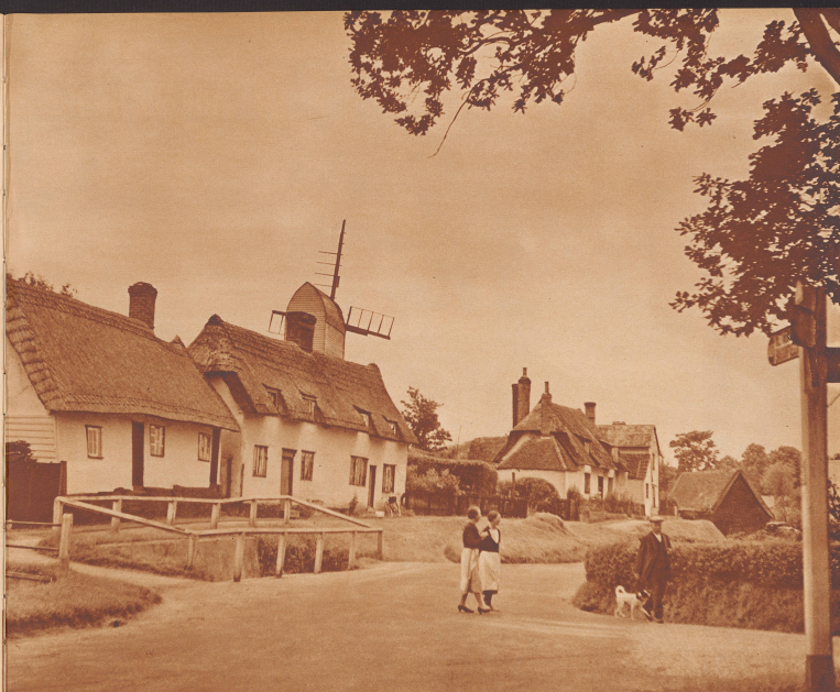
Die Häuser des Dorfes Greenfield in der Grafschaft Essex sind noch mit Stroh bedeckt; die bedekten aber in England keine Scheunen, wo mit ihnen zusammen das mittelalterliche Wohnhausbild und der alte alpenländische Kiefern der Trümmen die Treue halten. Die verbleibende Windmühle erntet einen hohen Schilchobsttag im außer Betrieb. Es ist ein alter Bestandteil geworden, den man nicht mehr braucht, aber man läßt ihn stehen.

On honorerait sans doute le paysan anglais en lui montrant les fermes de l'Angleterre, les domaines féodaux que possèdent nos paysans. Les paysans anglais ne sont presque jamais propriétaires, ils travaillent comme par le passé pour le compte d'un maître et ne comprennent pas à ce jour de ce fait que leur affaire est prospère et qu'ils peuvent, leur travail terminé, recueillir le produit de leur labeur sans que le propriétaire ait rien de leur affaire.