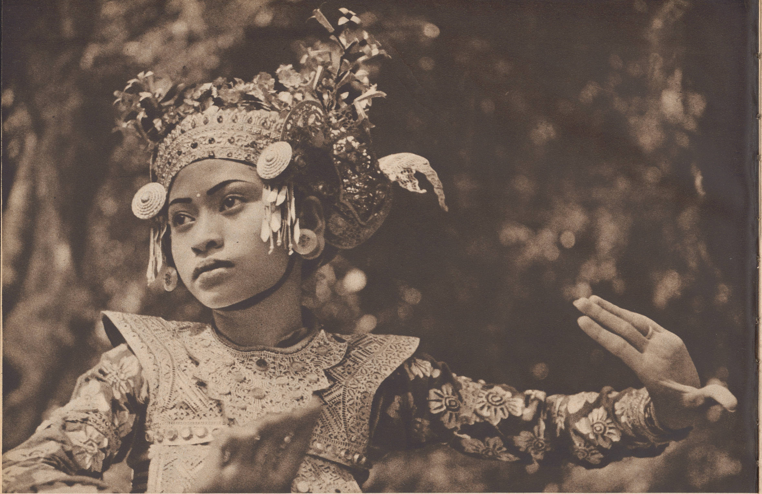
Balinesische Legongränzerin. Welch reiches und köstliches Gewand: edel vergoldetes Leder und blattvergoldete Seide! Und die zitternden Blumen des Kopfschmuckes sind aus reinem Goldblech gehämmert. Vêtue de soie précieuse, engoncée dans une carapace de cuir ciselée comme une armure d'apparat et dorée comme une chasse coiffée d'un casque que rehaussent des roses d'or pur et des pierreries, voici l'une des danseuses sacrée de Bali.

Unser Mitarbeiter Gotthard Schuh mit dem Fürsten Anak Agung von Saba.