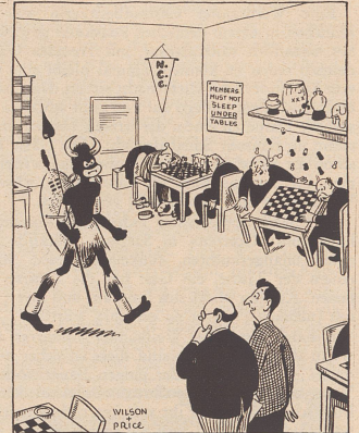
Hier kommt ihr Gegner; ich hoffe, er ist kein unangenehmer Verlierer. (Aus «Chess»)

wandert bis nach b4, nachdem er alle Bauern auf dunkle Felder gestellt hat und opfert nachträglich den Turm auf b3. Der Textzug beschleunigt den Untergang. 34. .. Td2×a2, 35. Kg1-g2, Kf8-e7 36. g3-g4, f7-f6 37. h2-h4, Ke7-d6 38. Kg2-g3, Ta2-b2 39. f2-f4, a7-a5 40. g4-g5, Kd6-c5, 41. Lc4-g8, Kc5-b4 42. f4-f5, Tb2×b3! 43. Lg8×b3, Kb4×b3 44. h4-h5, h7-h6! Bricht jeder Spekulation die Spitze. Es drohte h5-h6, g×h6, g5-g6 und Weiß bekäme rechtzeitig eine neue Dame mit Schachgebot. Nach dem Textzug gab Weiß auf. Diese Partie ist ein besonders schönes Beispiel klarer Spielführung und präziser Ausnutzung der kleinsten gegnerischen Unterlassungen.