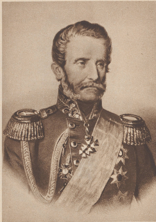
General Anton Heinrich Jomini (1779—1869)