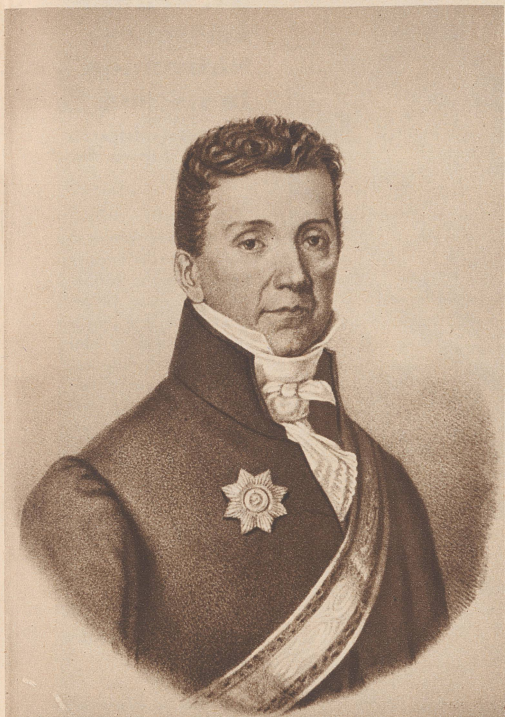
General Niklaus Rudolf von Wattenwyl (1760—1832)

Er entstammt einer der ältesten Berner Familien. Mit 17 Jahren steht er bereits als Fähnjenker in holländischen Diensten. 1783 kehrt er nach Bern zurück und zeichnet sich während der Schlacht bei Neuenegg (1798) als Kommandant des Füsilierbataillons des Regiments Thun aus. Während der Helvetik wird er Schultheiß von Bern, 1804 Landammann der Schweiz. 1805 ernennt ihn die Tagsatzung zum General und beauftragt ihn, die Grenze gegen Deutschland zu schützen. 1813 steht er wiederum an der Spitze der Eidgenössischen Armee, die das Land vor einem Einmarsch der Alliierten zu schützen hat. Eben ist er von einer Krankheit genesen und noch tief erschüttert durch den Tod seines Sohnes Albert, doch er schreibt an die Tagsatzung: «Die Existenz der Nation zu retten, ist das höchste Ziel, das man im Auge haben muß; alles andere ist Nebensache.»