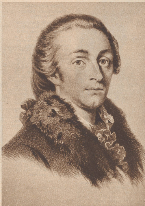
General Theodor Reding (1755—1809)