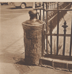
Dieses Kanonenrohr, aufgestellt an einer Straßenecke, ist ein Zeuge der Vergangenheit, als sich um New Bern heftige Kämpfe abspielten. Un canon dans le où se situent canon qui tomba lors de la guerre d'indépendance. Il est resté dans le où se situent canon qui tomba lors de la guerre d'indépendance.