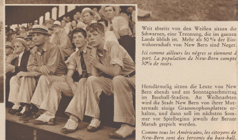
Weit abseits von den Weiden sitzen die Schwärzer, eine Truppe, die im ganzen Lande üblich ist. Mehr als 50% der Einwohnerstadt von New Bern sind Negro!