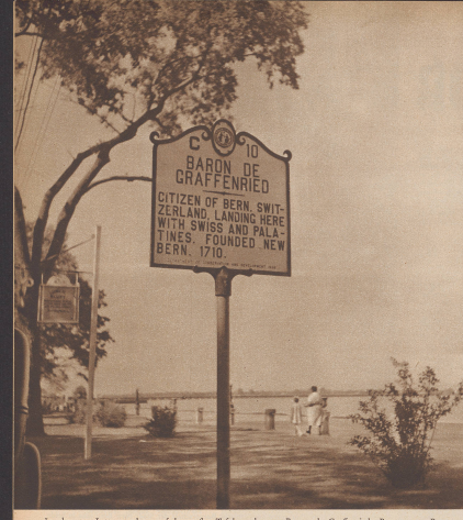
In schwarzen Letzern steht es auf der großen Tafel zu lesen: »Barron de Graffenried, Bürger von Bern, Schweiz, landete hier mit Schweizern und Palatinen und gründete 1710 New Bern.« Dill vor zwei Jahren an der Peripherie der Stadt wachsenden Vorkriegszeit ist nach diesem Berner Bürger Graffenried'sche genannt worden. »Le Barron de Graffenried, bourgeois de Berne en Suisse, accompagné de Suisses et de Palatins, arriva en ces lieux et y fonda New-Bern en 1710, indique ces événements. Il y a deux ans, le nom de Graffenried-Park lui donné à un jardin public de la ville.