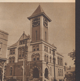
Das Stadhhaus »City Hall« von New Bern. Hat es nicht eine gewisse Ähnlichkeit mit dem Berner Zentenkloster? Hier amtes der Gemeindevorstand, die Gemeindevorwaltung und das Gericht. Il faut beaucoup de bonne volonté pour trouver une analogie entre l'hôtel de ville de New-Bern et la »Zynglerkloster«.