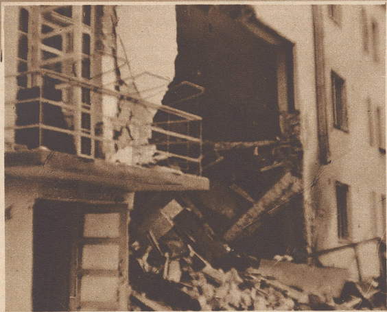
In diesem Hause in einem Dorfe irgendwo hinter der karelischen Front hatte sich eine freiwillige dänische Ambulanz mit Personal, Material und Wagenpark etabliert. Bei einem nächtlichen Bombenangriff auf das Dorf wurde das Haus von einer Bombe so schwer getroffen, daß es geräumt werden mußte.

L'ambulance a reçu l'ordre de se rendre dans un autre secteur. Nous la voyons ici en route vers l'endroit qui lui a été désigné.