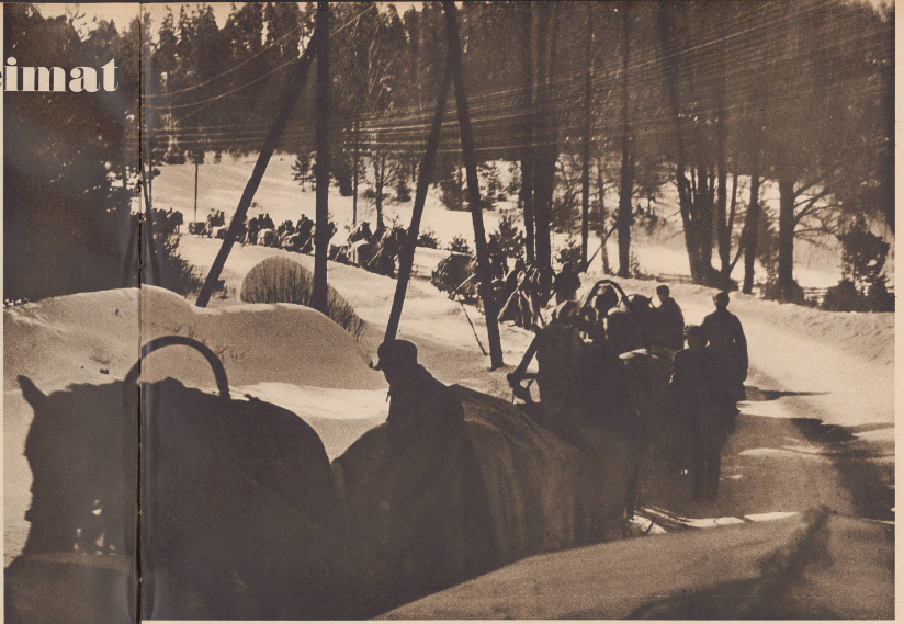
Rund 90 000 km 2 finnisches Land gehen laut dem Friedensvertrag von Moskau an Rußland. Auf diesem Gebiet wohnten rund 450 000 Menschen. Die finnische Regierung hatte sie jedoch freigestellt, an seinem bisherigen Wohnort zu verbleiben oder nicht. Fast zu 100% entschieden sich die Leute für ihre alte Heimat Finnland. So hoch gleich nach der Unterzeichnung des Friedensvertrages die große erwartete Prozentsatz im Fuß auf Schritten, in Autobussen und auf allertand modernen behelfsmäßigen Fahrzeugen zur dem abgetrennten Gebiet nach Westen an. Seit Samstag, dem 16. März, 12 Uhr, rückten die Russen täglich 7 km ins abgetrennte Gebiet ein. In unvorstellbarem Tempo wurde die Bevölkerung zurückgeworfen. En vertu du traité de paix finno-russe, les Finlandais ont dû laisser environ 90 000 kilomètres carrés de leur patrie entre les mains des Russes. Le gouvernement Finnois avait laissé libre les 450 000 habitants de ces contrées de choisir entre l'exil et l'épave russe. Presque tous décidèrent de répondre à leurs racines finnoises. À partir du 16 mars, les Russes entrèrent au rythme de 7 kilomètres par jour dans les contrées prises par le traité de paix. Les habitants finnois durent se retirer à la même vitesse.