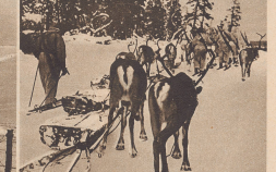
Ganz oben im Norden, im Gebiet von Petsamo, brachte der Friedensvertrag keine territorialen Veränderungen. Ungefähr 100 000 Finnen, die zu Beginn des Krieges mit ihren Kameraden und schwedischen und norwegischen Gebiet geflüchtet waren, können in ihre Heimat zurückkehren. Bild: Finnische Truppenkolonie mit Remontierbespannung auf dem Rückmarsch nach Petsamo. Dans le nord, aucun changement n'a été prévu par le traité de paix. Environ 100 000 Lapons qui avaient fui en Suède et en Norvège peuvent rentrer en pays. Photo: Colonie des troupes du traité finno-russe en marche vers Petsamo avec ses attelages composés de rennes.