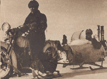
Die letzten Soldaten zogen aus einem kleinen Dorf auf der Karelichen Landenge ab. Ihr Motorrad ist auf ein Schliffenfahrzeug montiert, der Anhänger ist aus den Überresten eines abgebrannten russischen Bombenbrennstoffes. Les derniers soldats finlandais quittent un petit village de l'isthme de Carélie. Une motocyclette installée sur deux patins à neige tire une remorque construite sur les débris de la carlingue d'un bombardier russe abattu.