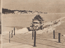
Die Halbinsel Hangö wurde in der Nacht vom 22./23. März den Russen übergeben. In drei Tagen vom 13.-22. März ritten Hunderte von Lastwagen mit Aukwaatungsmaschinen über die gefrorene Meereshöhe nach Ekas, wo die 15 000 Bewohner von Hangö vorerst untergebracht wurden. La péninsule de Hangö a été abandonnée aux Russes dans la nuit du 22 au 23 mars. Pendant les jours qui suivirent, des centaines de camions ont transporté les biens des 15 000 habitants de Hangö à Ekas, endroit auquel ils seraient leurs possessions finnoises.