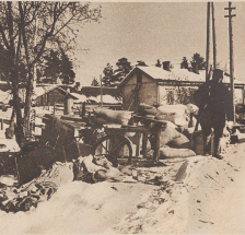
Möblier und Lebensmittelvorräte warten auf den Abtransport. Begleitpersonen nahmen die Finnen möglichst viel von ihrer Habe mit. Das ging hin, was wertvolle Maschinen, Rohstofflager und Industriematerialien anbelangt, weil lange vorher schon entsprechende Maßnahmen getroffen worden waren. Viele kleine Leute aber mußten von ihren Habeleistungen manchen nachlassen, weil ein normaler Abtransport bei dem ungewohnten Anstieg einfach unmöglich war. Eine besonders schwierige Aufgabe war der Abtransport der Tiere. Mehr als 50 000 Kühe mußten evakuiert werden. Des sièges et des parties de mobilier attendent d'être transportés en pays non envahis. On comprend que les Finlandais aient cherché à sauver la plus grande partie possible de leur avoir. Ils réussirent à sauver de nombreuses pièces avant tout, à sauver les machines de leurs usines et même d'importantes réserves de matériaux. Mais, par contre, bien des petits gens durent abandonner leur biens faute de moyens de transport et à cause de la rapidité du départ. La principale difficulté fut l'évacuation du bétail. Plus de 50 000 vaches furent évacuées vivantes.