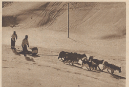
Auf großer Fahrt im prallen Sonnenschein. «Aimable», der Leitchund an der Spitze, auch den besten Schnee aus, bleibt instinktiv auf der guten Piste und reißt wie ein Magnet seine Kameraden mit. En plein effort! Le chien de tête «Aimable» choisit la meilleure neige, reste sur la piste et avec élan, avec embouscane elle entraîne ses camarades.