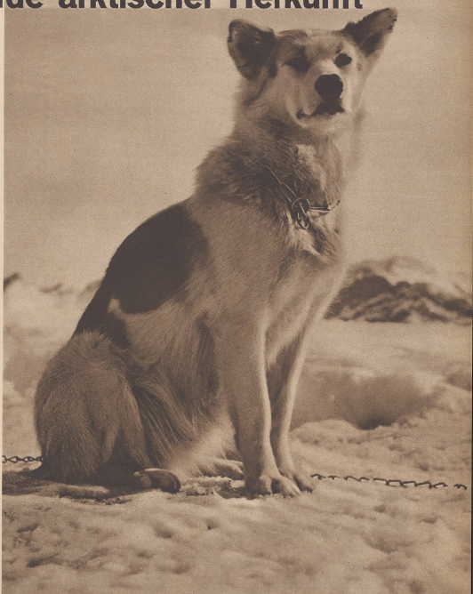
«Aimable», des Letzter der Ahtergruppen, der beste Tier der Gruppe, eine intelligente, gutmütige Hundin, gebürtig aus der Gruppe der arktischen Nordpolen in Boucha, im Norden Nordens Kanadas. Während fast zwei Jahren diese «Aimable» als Leitchund bei der Schweizerischen Entropfungs- Expedition 1938/1939 an der Hudsonbai. Dann brachte sie der Forscher Gabut mit drei ihrer Kinder, «Akra», «Natcherk» und «Goupi», nach Europa.