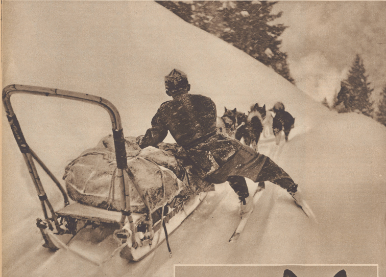
Die Ladung ist schwer, 200–300 Kilogramm, der Weg neu verzeichnet, der Anstieg steil. Für diese mühselige Bewegung, die da alle nicht im Halbtag geht es aufwärts, der Fahrer wird nur so mitgerissen und hat alle Mühe, die großen Geschwindigkeiten wegen, den Schlitten auf der guten Piste zu halten. La charge est lourde, la piste raide... avant le conducteur des chiens, un montagnard, un itinéraire, retenu le traicou de côté pour l'épave de dévaler.