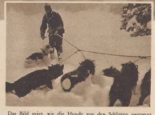
Das Bild zeigt, wie die Hunde vor den Schlitten gespannt werden. Es geschieht auf die von den Eskimos gebräuchliche «Alaska-Art» ein Hund an der Spitze zieht die Leitcher, die anderen Hunde je zwei und zwei nebeneinander. Voici la forme d'attelage des eskimaux, où un chien seul en avant, le chien de tête et les autres chiens sont attachés deux par deux. Habituellement à une forte corde centrale.