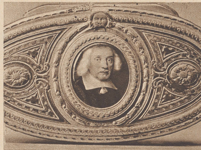
Der Miniaturmaler Jean Petitot (Selbstbildnis) Original im Musée d'Art et d'Histoire, Genève

Und nicht nur das Ihre. Wie oft hatte sie Jean veranlaßt, ihr von seinem Leben zu berichten, das bunt und ereignisreich gewesen war und ihn schon zu hohen Ehren geführt hatte, ehe sie sich noch kennengelernt hatten. Jeans Leben war ihr so vertraut, ihm nachzudenken, es