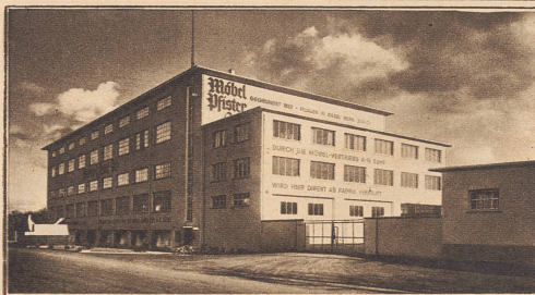
Teilansicht einer neuen Fabrik in Suhr bei Aarau

Sie liegt an der großen Überlandstraße Zürich-Bern. Hier werden sämtliche, bei der Firma Möbel-Pfister AG. (gegr. 1882) Basel, Zürich, Bern bestellten Wohnungseinrichtungen sorgfältigst vorbereitet, um dann von dieser Zentrale aus mit modernen Polster-Camions abgeliefert zu werden. Außerdem birgt diese Fabrik große Ausstellungs- und Verkaufsräume. • Tausende junger Ehepaare aller Kreise bevorzugen gerade wegen ihrer besonderen Gepflegtheit die schönen Einrichtungen dieses altbewährten schweizerischen Vertrauenshauses.