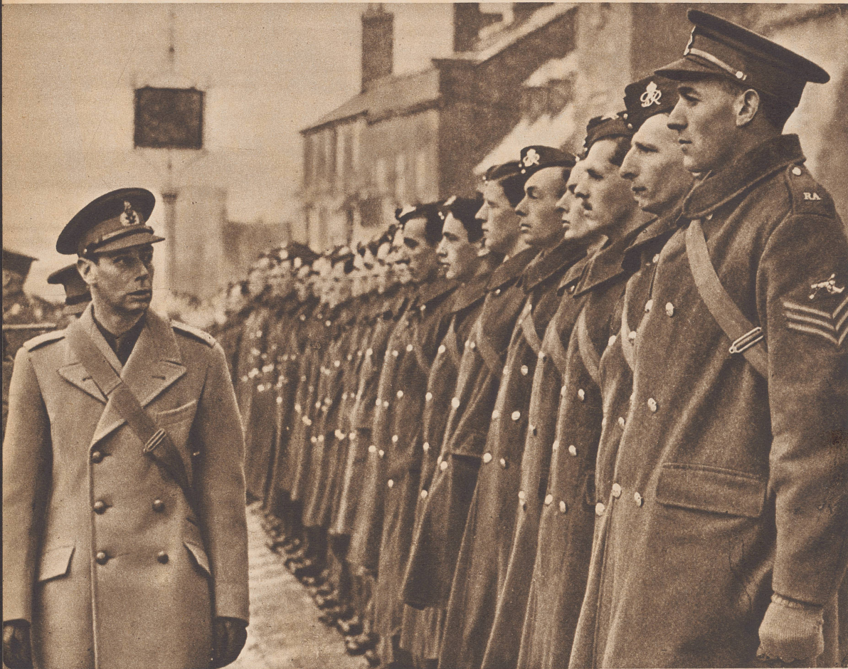
Der König bei einer Truppeninspektion. ...les fantassins...

D'une aube à l'autre à travers tout le pays Leurs Majestés britanniques se dépensent sans relâche . . . inspectant . . .