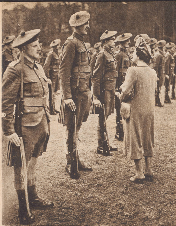
Die Königin im Gespräch mit einem besonders großgewachsenen Schotten während eines Besuches bei den in Kent stationierten Schotten. ...les célèbres soldats de l'Ecosse...