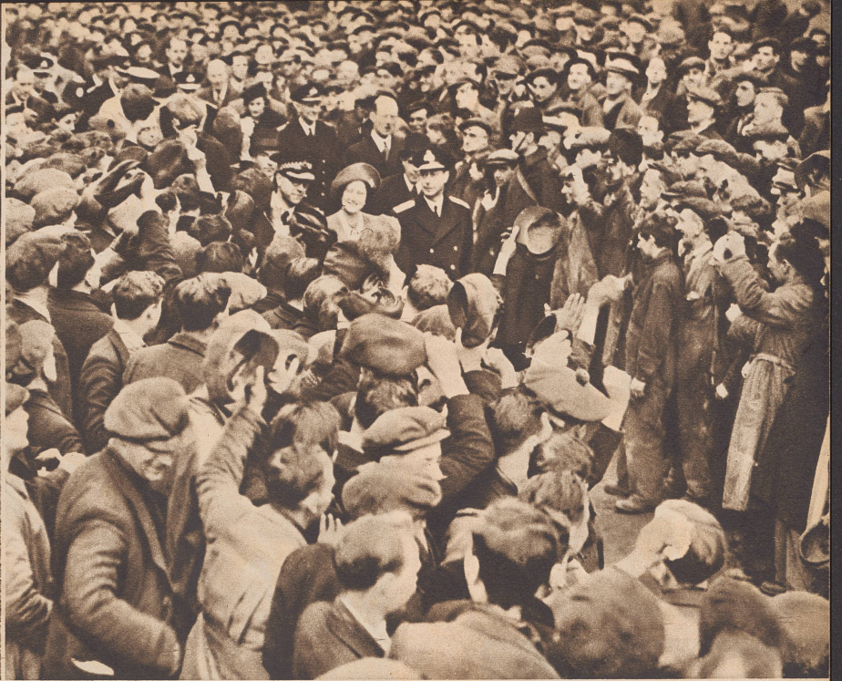
Das englische Königspaar wird beim Besuch einer Schiffswerft von den Arbeitern begrüßt. ...visitent les chantiers navals d'Ecosse...