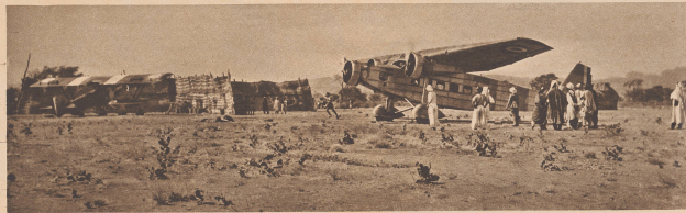
Arrière, in action, die Kommandant militärisch der Region de Tibesti, à Zouar. Sur tous le territoire du Tibesti, d'une superficie qui égale à 4 fois à peu près celle de la Suisse, les Français ont une douzaine de postes militaires, dont les plus importants sont Zouar, Bouda et Faya. Commandés par des officiers coloniaux français, ces troupes sont formées de sous-officiers et soldats indigènes.