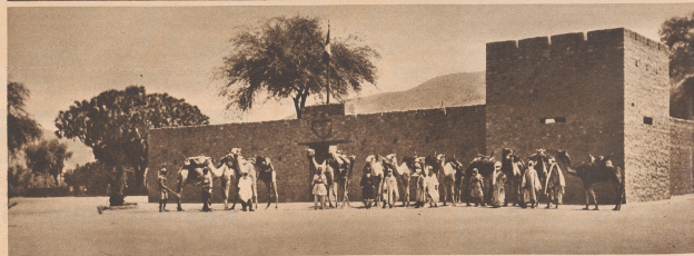
Die Militärlagerung von Aoua, der Hauptposten des Gebiets, das 1935 von Französisch-Tibesti abgetrennt und Italienisch-Libyen angegliedert werden sollte. Die Abgrenzung 114.000 km 2 nennenden Gebiets kann indessen nicht standhalten, weil Italien 1934 auf diese Gebiete verzichtete. Le poste militaire d'Aoua, le plus important de la région, dans la crèche à l'état actuel, primitivement prévue avec celle du territoire de 114.000 kilomètres carrés qui borde la frontière de Libye.