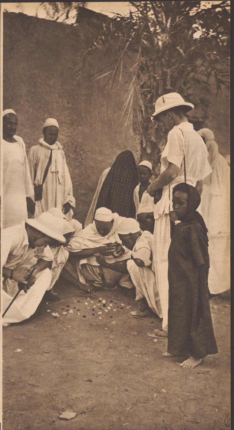
An gutem Einvernehmen zwischen den farbigen, einst kriegerischen Eingeborenen und den weißen Kolonialoffizieren als den neuen Herren des Landes fehlt's an diesem exponierten Posten des französischen Imperiums nicht. Auf einem im Sand gezogenen Damenbrett spielen ein französischer Leutnant und ein Tibbumann eine friedliche Partie.

Im Osten der Sahara, halbwegs zwischen dem Mittelmeer und dem Tschadsee, erhebt sich aus dem riesigen Sandmeer ein gigantisches, zerklüftetes Gebirgsmassiv: der Tibesti. 1822 und 1823 wurde Tibesti zum erstenmal von Europäern, den Engländern Denham und Clapperton, besucht. Später waren auch die deutschen Forscher Barth (1855), Rohlf's (1856) und Nachtigall (1869) dort und haben mancherlei Unbekanntes über die geheimnisvolle Landschaft berichtet. Die 15 000 Bewohner des Tibesti, dunkelbraun bis kupferrot in der Hautfarbe, bilden den zu den Sudanegern gehörenden Stamm der Tibbu. Sie treiben Kamel- und Ziegenzucht und pflanzen Gemüse und Datteln. In früheren Zeiten hausten in den Schlupfwinkeln des Tibesti auch die berühmten «Rezzous», die berittenen Räuber der Sahara, die auf ihren flinken Méharis Raubzüge bis auf 500 Kilometer Distanz zur Plünderung von Handelskarawanen unternahmen. 1912 bis 1917 wurde der Tibesti von den Franzosen erobert. Seither hat Frankreich nichts unterlassen, diesen Eckpfeiler seines riesigen afrikanischen Kolonialreiches an der Grenze von Italienisch-Libyen zur festen militärischen Bastion auszubauen.