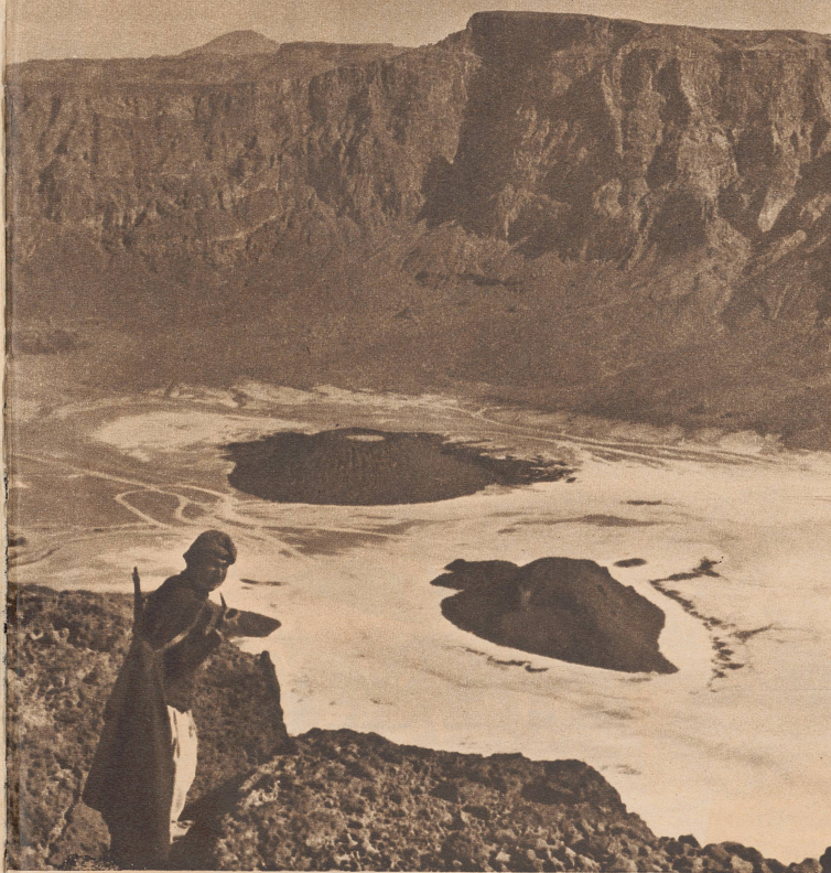
Die große geologische Schenswürdigkeit im Tibestimassiv: «Le Trou au Natron», ein mächtiges, auf dem Grund eines Riesenkaters liegendes, durch Verdunstung entstandenes Salzlager. Im Krater selbst hatten sich später neue kleine Vulkane gebildet, die aber heute alle erloschen sind. Ein Marsch zu Fuß um den Krater nimmt einen ganzen Tag an Zeit in Anspruch.

Une des plus intéressantes curiosités géologiques du massif du Tibesti: «Le trou au Natron», aux proportions impressionnantes, il faut un jour pour le contourner et un autre pour descendre. Le fond du cratère est tapissé de sels étincelants et est percé de petits cratères, qui ne sont plus en activité.