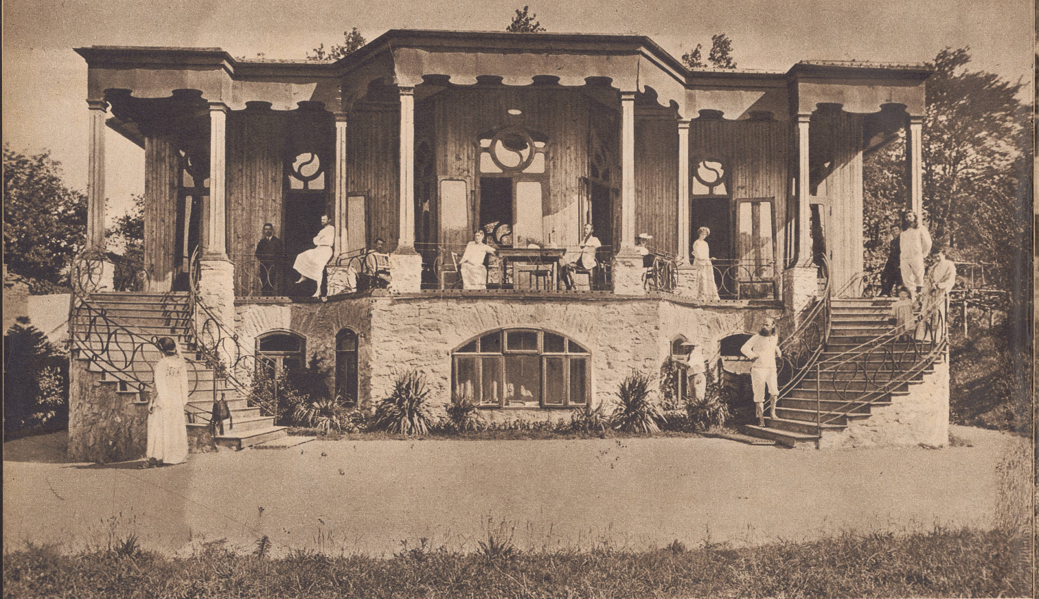
Das Hauptgebäude der Naturheilstätte, das 1904 errichtet wurde. Es bildete einen beliebten Sammelpunkt sowohl für die Monte-Veritaner als auch für Fremde und Freunde. Das flache Dach war ursprünglich dazu ausgenutzt worden, dank gläsernen Wänden im Winter als Sonnenbad zu dienen. Heute steht hier das ansehnliche Restaurationsgebäude des Hotels Monte Verità. Le bâtiment central du sanatorium, construit en 1904, lieu de réunion des habitants et de leurs hôtes, est aujourd'hui un restaurant de l'Hôtel Monte Verità.