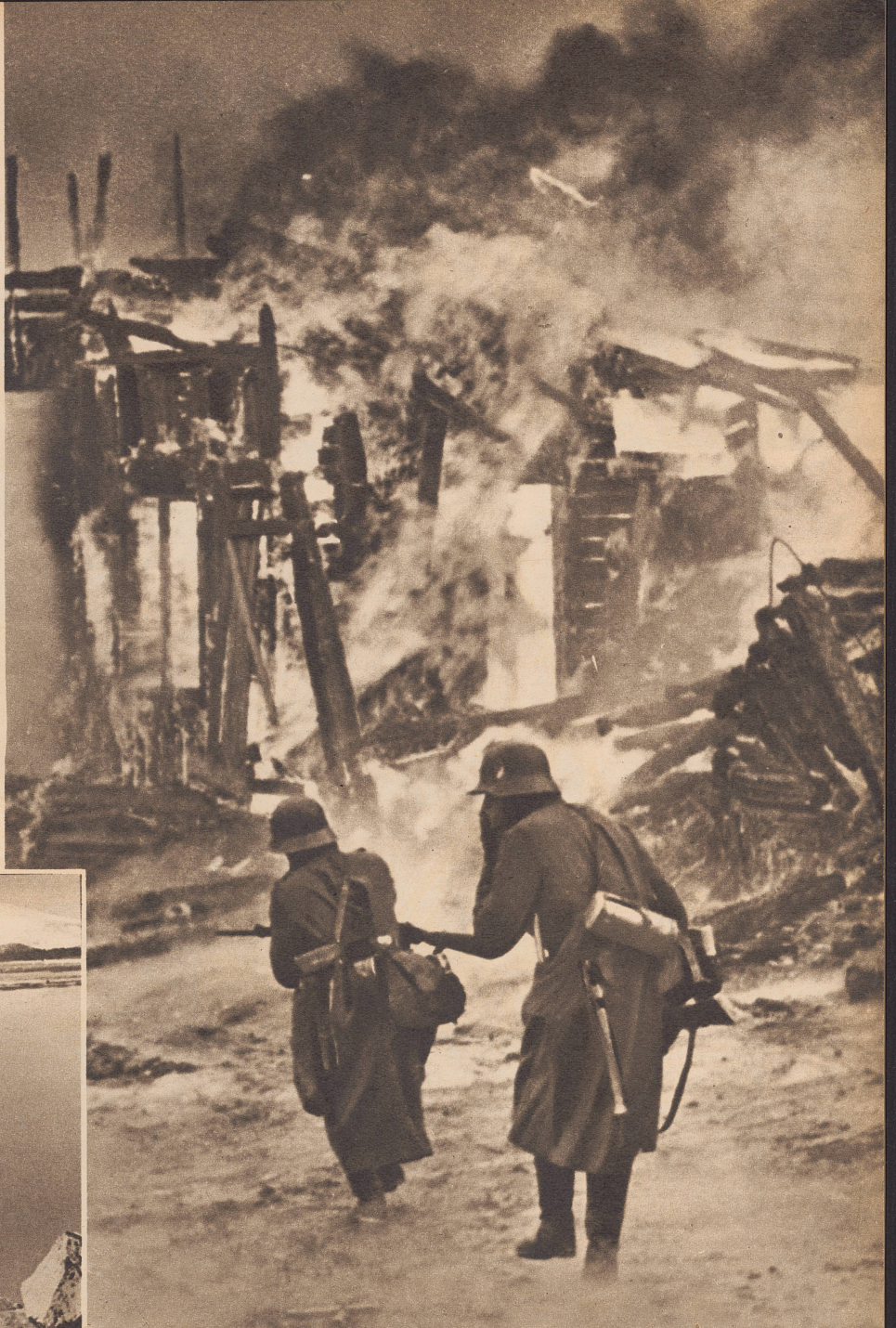
Auf dem Vormarsch nach Norden. Deutsche Patrouille dringt in ein Dorf im Ranatal ein, das von Fliegern mit Brandbomben belegt worden ist. Im Ranatal, der Fortsetzung des langgestreckten, engen Ranafjords, ungefähr 200 Kilometer nördlich Namsos und 300 Kilometer südlich Narvik, ist der deutsche Vormarsch nach Norden am 20. Mai zum Stehen gekommen.

Seit die große Schlacht im Westen entbrannt ist, hört man weniger vom Krieg in Skandinavien. Immerhin besagen die spärlichen Nachrichten und die Bilder, die aus dem Norden zu uns gelangen, daß in Norwegen keineswegs Friede herrscht. Etwa so könnte die gegenwärtige Situation in zwölf Zeilen beschrieben werden: Die Deutschen haben Südnorwegen in ihrem Besitz. In den besetzten Gebieten haben sie die Wiederaufbau- und Befestigungsarbeiten in die Hand genommen. Bis jetzt sind rund 250 000 Mann deutscher Truppen in Norwegen gelandet worden, aber täglich treffen neue Truppen und Materialtransporte ein. Der deutsche Vormarsch nach Norden scheint zum Stehen gekommen zu sein. Narvik ist seit 28. Mai in den Händen der Alliierten. Die vereinigten Norweger und Alliierten kämpfen weiter gegen die Deutschen um den Besitz der Erzbahn.