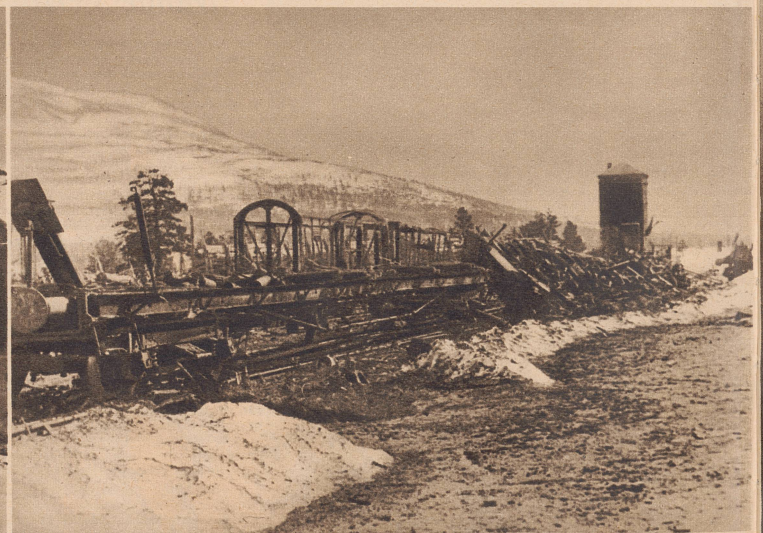
Ausgebrannte Eisenbahnwagen in einem Hafenort Südnorwegens. Wer das Zerstörungswerk vollbracht hat, ist nicht festzustellen. Die Deutschen mit ihren Bombenangriffen oder die Engländer vor ihrem Abzug in die Heimat? Dans un port du sud, des wagons de chemin de fer détruits par les bombardements.