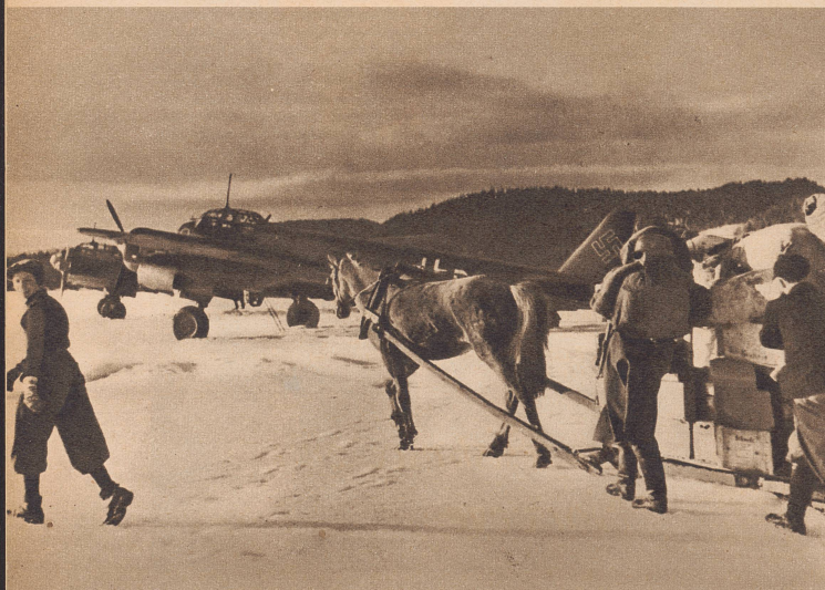
Im Süden Norwegens ist der Frühling angebrochen, in Mittel- und Nordnorwegen liegt noch eine alte, vielerorts einen Meter messende Schneedecke über dem Land. Die noch nicht geschmolzenen Eisdecken der Seen dienen den deutschen Bombern und Warentransportflugzeugen als Start- und Landeplätze. Si dans le Sud de la Norvège le printemps est déjà là, le Nord et la moyenne Norvège subissent encore les rigueurs de l'hiver et par place la couche de neige atteint encore un mètre. Les Allemands utilisent comme place d'atterrissage la surface glacée des lacs.