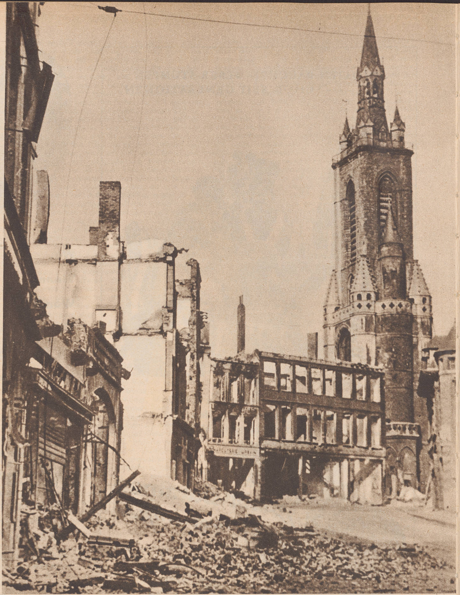
Tournai , das belgische Industriestädtchen, nach der großen Flandernschlacht. Tournai, la petite ville industrielle belge, après la grande bataille des Flandres.