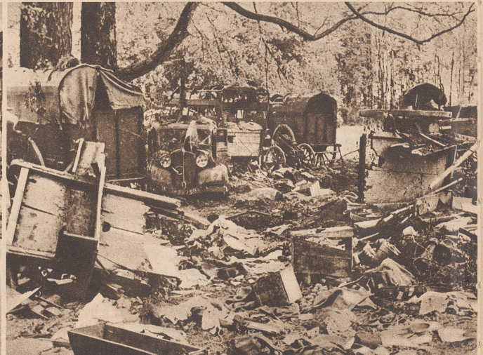
Ueberreste einer französischen Munitionskolonie nach dem Angriff durch deutsche Sturzkampfbomber. Les restes d'une colonne française de munitions, attaquée à coups de bombes.