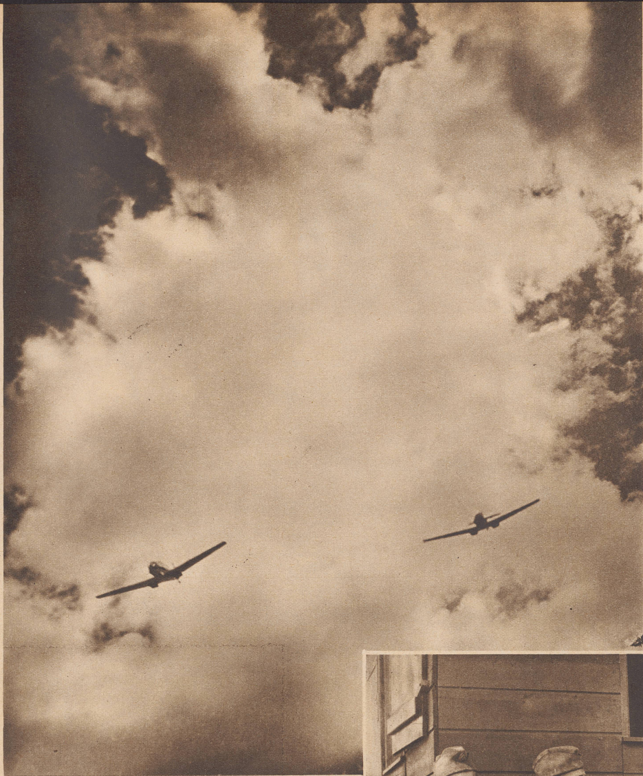
Zwei Messerschmitt-Maschinen einer schweizerischen Jagdstaffel auf Patrouillenflug. Mit 550 Kilometer Stundengeschwindigkeit rasen sie durch den Luftraum. A une vitesse de 550 km-heure, deux de nos Messerschmitt patrouillent dans le ciel. N/F 751