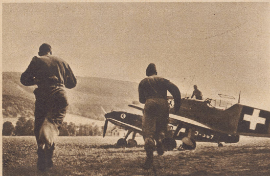
Alarm! Von irgendeinem Posten des Fliegermelde- und Beobachterdienstes sind in der Schweiz eingeflogene fremde Flieger gemeldet worden. Innerst wenigen Sekunden sind die Maschinen von der Bodenmannschaft startbereit gemacht, von den Piloten bestiegen und gestartet und in wenigen Minuten schon am Horizont verschwunden.