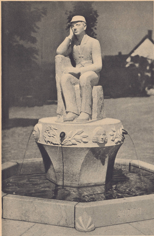
Der Gottfried-Keller-Brunnen in Glatzfelden

von Bildhauer E. Heller, der den «Grünen Heinrich» darstellt und am 50. Todestage des Dichters eingeweiht wird.