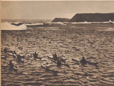
Vor einer Stunde ist das Schiff als kleine Silhouette am Horizont entdeckt worden. In langem Fahrt ist es sich der Küste. Eine Flottille von Kajaks fährt der »Svirfidliken« zur Begrüßung entgegen. Le bateau est signalé, il mit la côte au ralenti. Une flottille de kajaks l'emprunt à la rencontre.