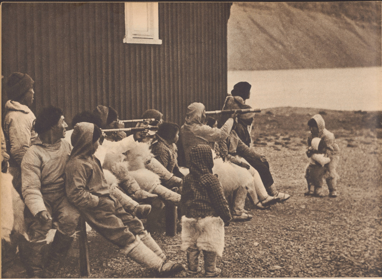
Die Leute von Thule kennen aus Erfahrung das ungefähre Ankomme des Schiffes. Es kann einige Tage früher oder später im August sein, je nachdem wie das Wetter auf der Überfahrt sich macht. Stundenlang sitzen die Thuler täglich auf dem Ausguck, einige mit Fernrohren bewaffnet, jedermann gespannt und bereit, zu erster Meldung zu können: »Das Schiff kommt, ich sehe es!« Comme nous le dite approximative de la venue du bateau, les habitants surveillent la mer durant des jours afin d'en signaler l'arrivée dès qu'il apparaît à l'horizon.