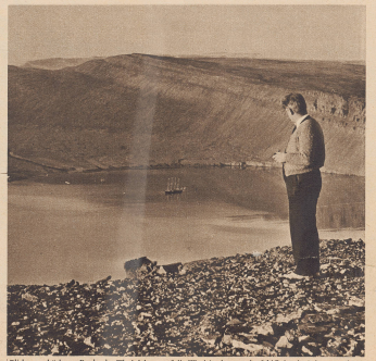
Blau vom höchsten Punkt des Thulefelsen auf die Thulebucht, wo das Schiff der dänischen Grönlandsverwaltung »Svirfidliken« vor Anker liegt. Der Mann, der da steht, ist der Kapitän des Schiffes. Vue du haut du rocher de Thule qui domine la rade dans laquelle est amarré le bateau de l'administration. Au premier plan, le capitaine du bateau.

Au Groenland, à l'extrémité de la presqu'île de Hayes, un peu au nord de la baie de Melville, se trouve le petit village de Thule où vivent une centaine d'Esquimaux. A Thule, on est une petite station commerciale, fondée par l'explorateur danois Rasmussen. Depuis un long et ce n'est que durant sept à huit semaines (août-septembre) que la côte est libre de glace. C'est à cette époque, une fois par an, que le bateau de l'administration danoise du Groenland visite Thule, visite qui constitue pour les habitants de la station le plus grand événement de l'année. Le bateau qui fait escale pendant sept, apporte aux indigènes de la colonie des vivres, des munitions, des habits et quelques distractions et ramène à son tour ce que les indigènes peuvent avoir à vendre. C'est très intéressant, les habitants de Thule attendent avec impatience la venue du bateau de l'administration, à cause des richesses qu'on trouve dans la métropole. S'ils n'ont pas reçu par radio les nouvelles d'Europe, ils comprennent, à la baisse ou à l'augmentation des prix, que de graves événements se déroulent.