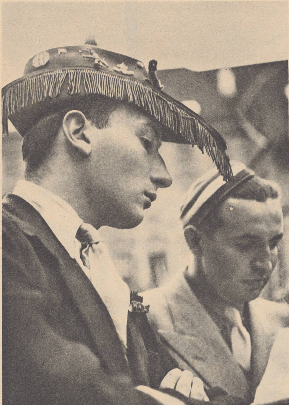
Gesichter vom Zentralfest des Schweizerischen Studentenvereins in Fribourg.

Participants à la fête centrale des étudiants suisses, à Fribourg.