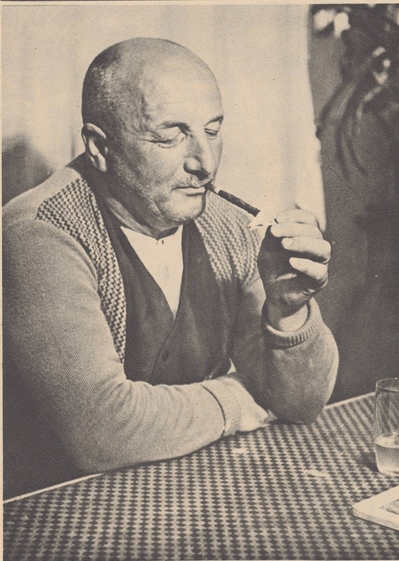
Bauer aus dem Thurgau während dem Jaß am Wirtstisch.

A regarder ce paysan thurgovien, on devine que la partie de yass se termina en sa faveur.