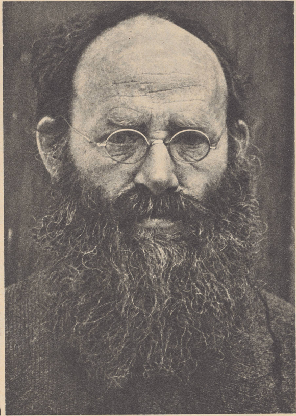
Sticker aus der Ostschweiz.

Participants à la fête centrale des étudiants suisses, à Fribourg.